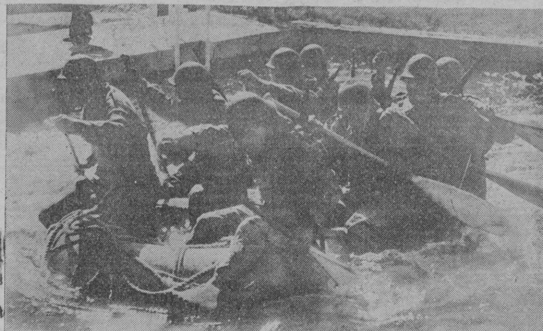
En los campos y pistas deportivos que el Ministerio de Marina tiene instalados en la Ciudad Lineal, se están celebrando los Campeonatos Nacionales Deportivos de la Marina. He aquí un desarrollo de las pruebas de "patrullas militares", en el marco reducido de una piscina. Las pruebas comprenden varias especialidades