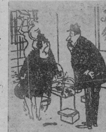
—¡Claro que me están bien, estápidol Anda y llama un taxi.

El nuevo sheriff de Benham Town está trabajando en el primer caso que se le presenta: le han robado un fero de su auto de Policía.