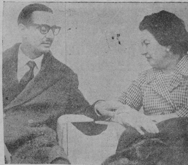
Janio Quadros, con su esposa Eloa, en el hotel donde se aloja en Londres

Por primera vez desde su marcha de Brasil, Janio Quadros rompe su silencio desde su exilio voluntario en Londres