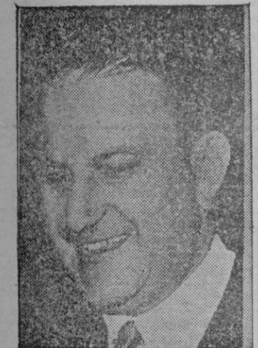
D. Fernando María Castiella

En este discurso, pronunciado durante la ceremonia organizada por los Caballeros de Colón frente a la estatua del descubridor en Unión Square, Iturralde puso de relieve que ya en el momento actual, los ciudadanos de Chile, Perú, Paraguay, Guatemala y Nicaragua que viven en España son considerados ciudadanos españoles a todos los efectos, mientras los españoles residentes en dichos países gozan también de la ciudadanía correspondiente. — Efe.