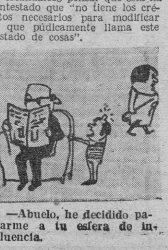
— Abuelo, he decidido pararme a tu esfera de influencia.

aquí para siempre, vida mía? — respondió el marido. LOS RECLUSOS SE VENGAN PARIS. — Uno de los más respetables Cuerpos del Estado es objeto de un insulto permanente en las personas de los magistrados del Tribunal de Tolón. En efecto, las oficinas de estos honorables servidores del Derecho se encuentran precisamente frente a las celdas de la prisión Saint Roch, y los detenidos no han encontrado nada mejor para emplear sus ocios que bombardear a sus dignos vecinos con los proyectiles más variados: bolitas, de pan, trozos de madera y hasta de hierro. Ante esta situación se ha dirigido una queja a la Administración penitenciaria de la ciudad. Es escandaloso pensar que ésta ha contestado que "no tiene los créditos necesarios para modificar lo que pídicamente llama este "estado de cosas".