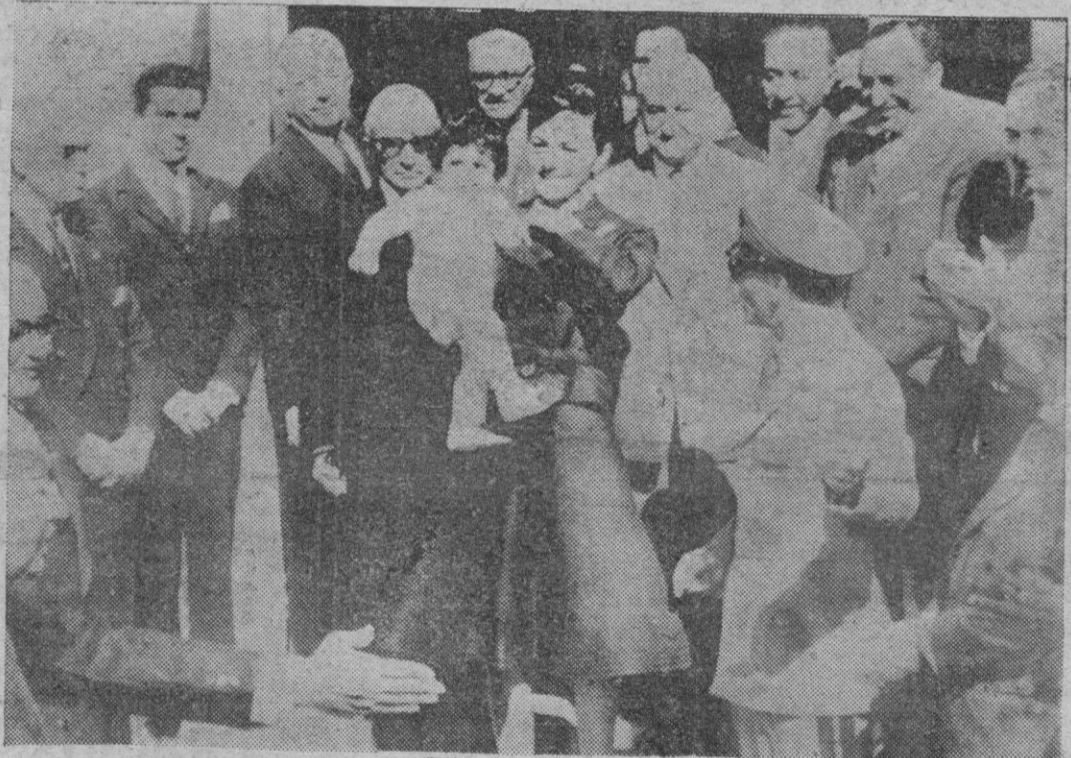
TEHERAN. — Trescientos delegados de todas las provincias persas contemplaron por primera vez al príncipe heredero Reza, que hace su salida oficial ante el público, en su primer aniversario. Sus padres, orgullosos, sonríen.