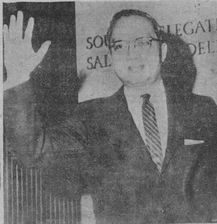
NUEVA YORK. — Después de su elección como Secretario provisional de las Naciones Unidas, el birmano U Thant saluda a las personas que le aclamaron

sobre el tapete y es que hoy tiene más importancia. Teóricamente está acordado que