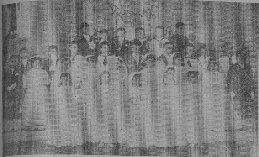
Grupo de niños de la parroquia de Nuestra Señora de Fátima del Castiñeiriño que celebraron la Primera Comunión el pasado día 27.