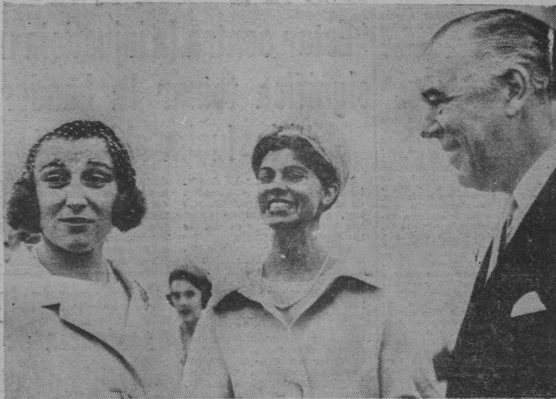
ESTOCOLMO. — La princesa Alejandra llegó a Estocolmo, donde permanecerá algunos días. En la foto, acompañada por el Rey Gustavo Adolfo y la reina Luisa a la entrada del castillo Ulfedal. (Foto Europa Press).