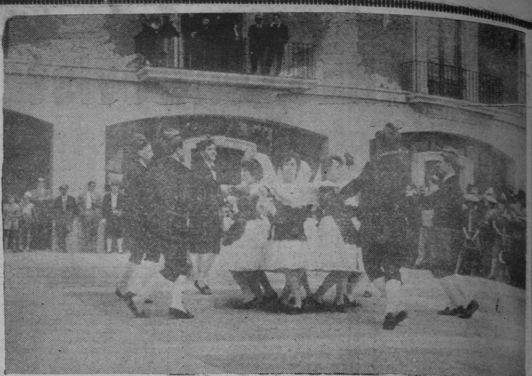
MADRID. — En la Feria Internacional del Campo, se ha celebrado el Día de Cataluña con diversos actos que han puesto de relieve la presencia de la bella región catalana, en la magna exposición abierta en el recinto de la Casa de Campo. A los brillantes actos asistieron los ministros del Ejército, de Economía, señor Gual Villalbi, así como el Cardenal de Tarragona, Dr. Arriba y Castro. En la fotografía, una exhibición de danzas regionales.

En el Palacio de Oriente los Ministros de Obras Públicas, Subsecretario de la Presidencia y Alcalde de Madrid inauguraron el Museo de Pintura, Muebles, Tapices y Ropajes Reales que ha quedado abierto al público. Las galerías en torno al patio, en las que ha sido colgada una colección de tapices única en el mundo.