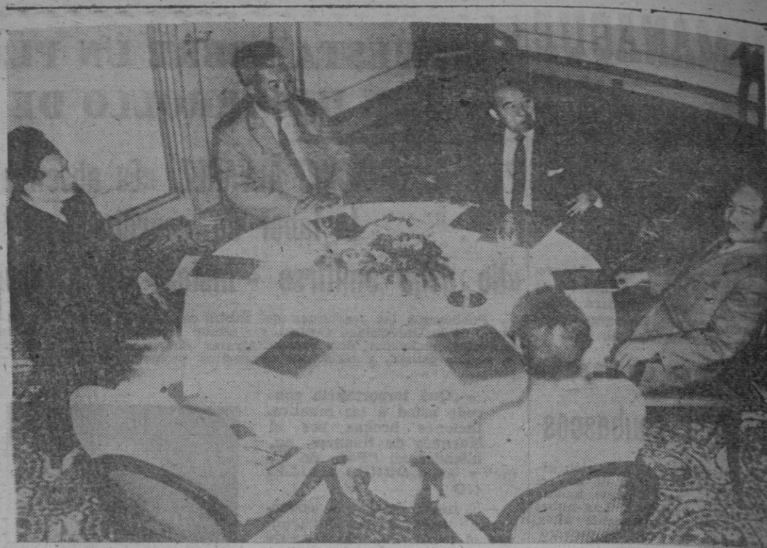
Los tres príncipes que están al frente de los grupos políticos más importantes de Laos se han reunido para discutir las posibilidades de establecer un Gobierno de coalición en su país. En el centro, Dolder, de izquierda a derecha, los príncipes Bun Uth, Savanna Fuma y Sufanuwong.