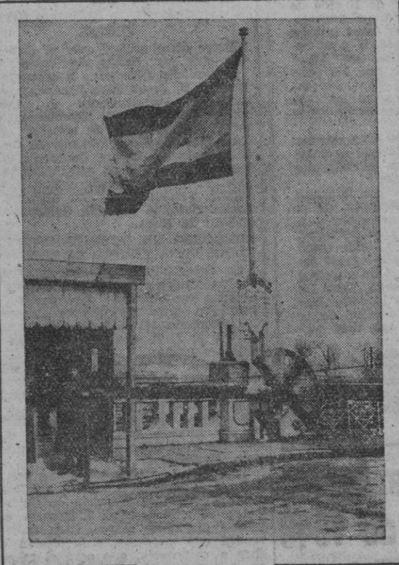
Una vista del puente internacional sobre el río Bidasoa, que separa España de Francia. En primer término, la barrera del puesto fronterizo español echada. A la izquierda, izada la bandera española. Desde las cero horas de hoy, 10 de febrero, queda restablecido el régimen normal para el paso de viajeros, mercancías, y para las comunicaciones aéreas, telegráficas y postales.