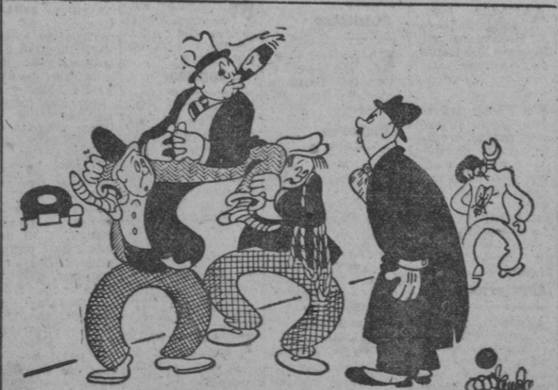
UN CASO, por Miranda

ROMA, 9.—El presidente central de los Hombres de Acción Católica ha enviado una circular a todas las residencias de las diversas asociaciones nacionales, en la cual se propone la constitución de una Federación internacional, con ocasión de los preparativos para el Año Santo de 1950. Dicha Federación tendría como temas los principios de "familia, Iglesia y trabajo". (EFE)