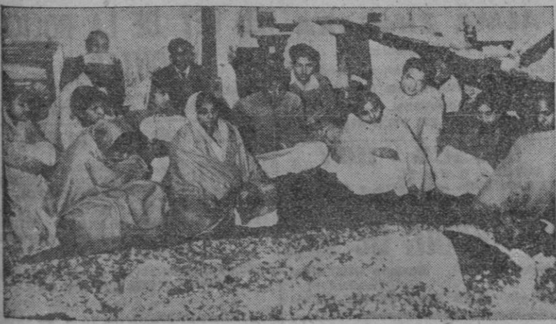
Los miembros de la familia rodean los restos del "Padre de la India", en la Birla House, donde se improvisó la última morada del Mahatma antes de llevar su cuerpo a la pira funeral.

WASHINGTON, 9.—En un breve discurso pronunciado en el Club Democrático Femenino, Howard Mc. Grath, presidente del comité nacional del partido democrático, manifestó que el voto femenino será decisivo en las próximas elecciones.