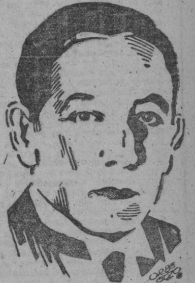
Presidente de El Salvador Don Salvador Castañeda Castro.

Entre las personalidades presentes en la Legación de España se hallaban el Presidente de la República, el Presidente de la Asamblea Nacional, los Ministros del Interior y de Cultura, el Arzobispo de San Salvador, el Subsecretario de Relaciones Exteriores y representantes diplomáticos acreditados en la capital salvadoreña.—(EFE).