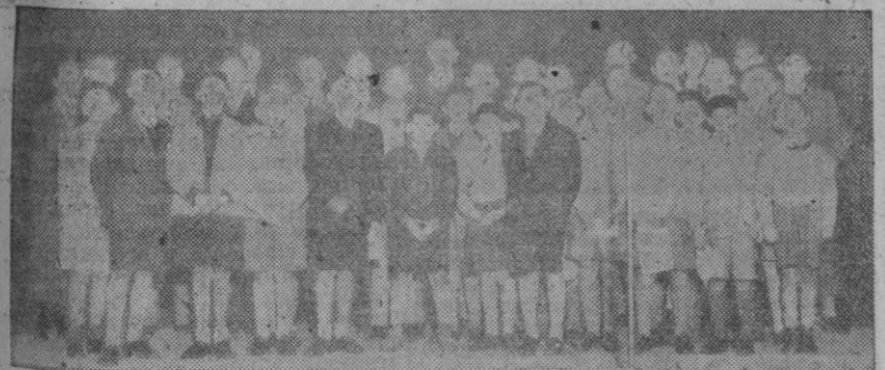
La Escolanía de los Estanislao que participó en el festival celebrado el domingo último por el Frente de Juventudes

Frente de Juventudes celebró la "Mañana del camarada"