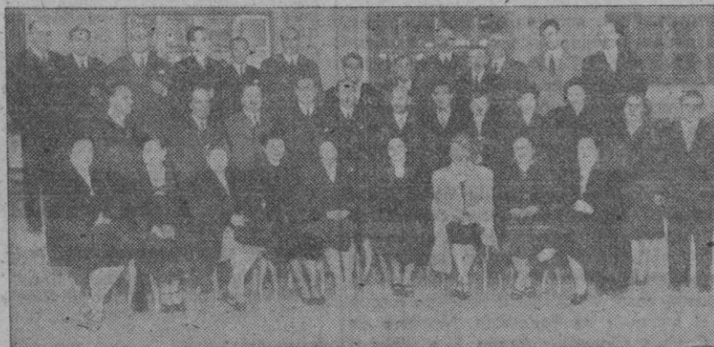
Odontólogos de La Coruña y Lugo que, con sus familias, celebraron la festividad de su Patrona, Santa Apolonia