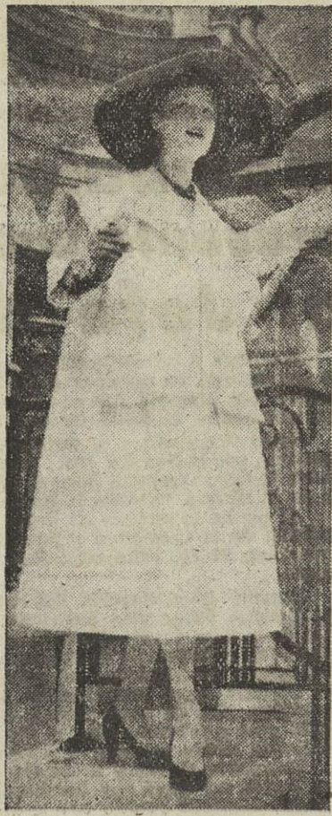
Una elegante en las carreras de Lough-champ, luciendo un bonito abrigo de "gros-grain" blanco. Un vestido de muselina blanca, todo plisado, le acompaña. Guantes (sombrero y adornos azules. Creación Naggy Rouff