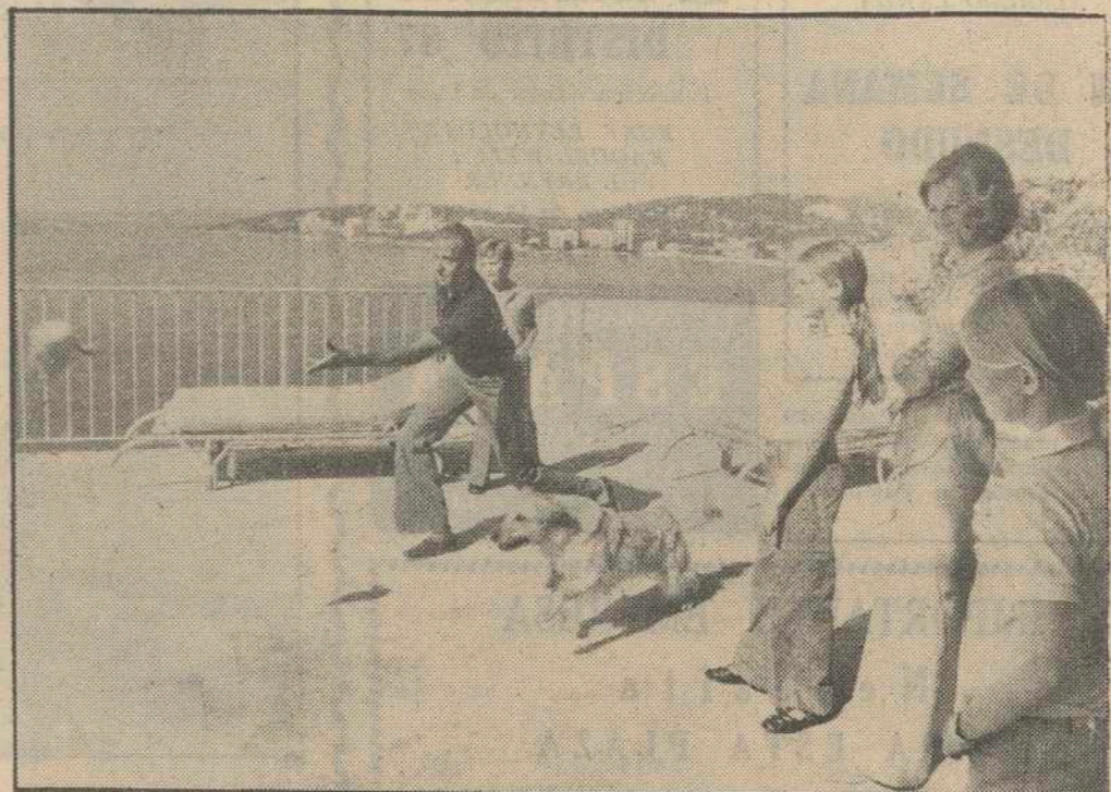
Los Reyes de España, Don Juan Carlos y Doña Sofía, se encuentran en compañía de sus hijos en el palacio de Marivent, en Palma de Mallorca, para disfrutar de unos días de descanso.