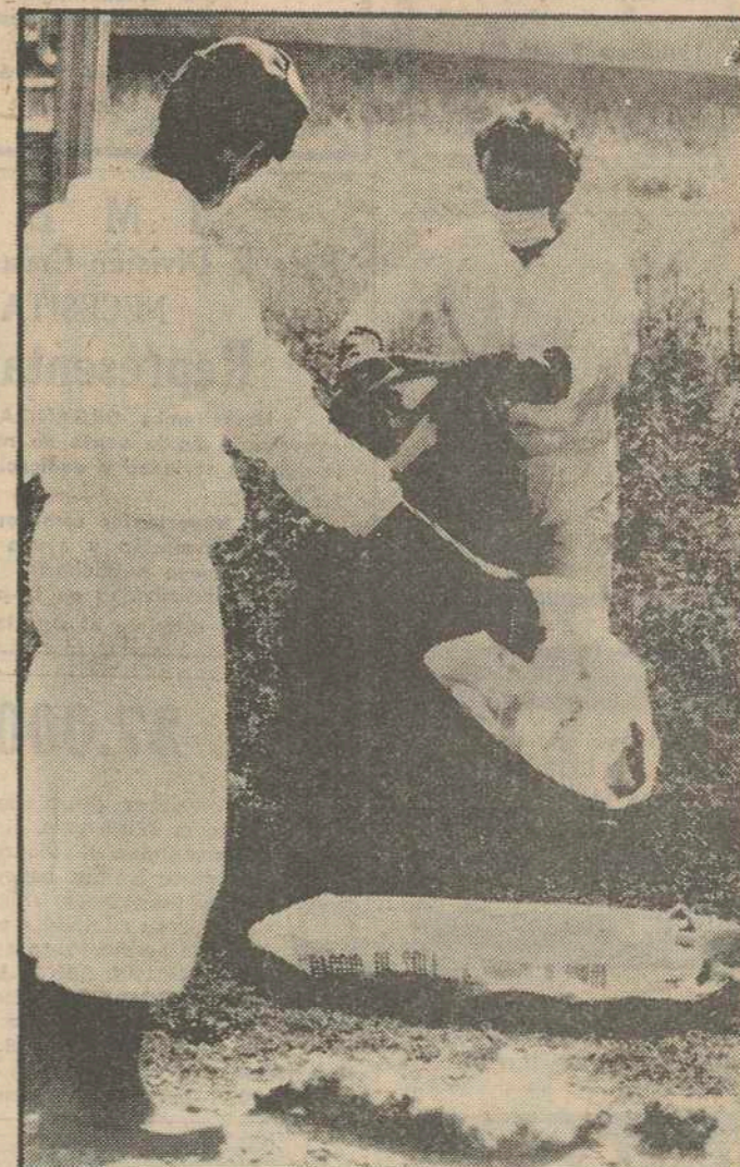
Las autoridades italianas han decidido continuar la evacuación de los habitantes de la región de Seveso, próxima a Milán, porque se ha descubierto que la zona contaminada por la nube tóxica es mucho más amplia de lo que anteriormente se pensaba. Numerosos animales, especialmente gallinas y conejos, como en el caso de la foto, han sido hallados muertos a muchos cientos de metros de las zonas primitivamente consideradas como peligrosas.