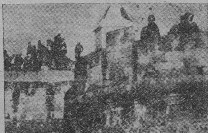
La guardia de la vieja prisión de Palermo, donde se ha producido un violento choque entre los sublevados y la Policía, ocupa los lugares estratégicos del recinto penitenciario, en ocasión de nuevas sorpresas. En el motín hubo un muerto y cinco heridos.

Subrayó Merbah que los ministros de Asuntos Exteriores de Francia y Gran Bretaña, en su reunión de París, el día 2 de febrero, acordaron que el primer ministro francés se trasladara a Moscú en fecha posterior.