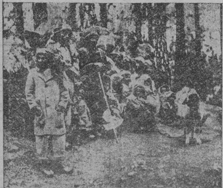
Refugiados de Cachemira que han abandonado su país, al ser anexionado por la India, para acogerse a la tutela del Pakistán.

La aguja de la actualidad salta de país en país con la misma facilidad con que se traslada, en un segundo, de estación a estación en el dial de nuestro aparato de radio: Roma, París, Nueva York, Moscú... Ahora, inesperadamente ha surgido un nuevo centro de interés y de inquietud: Cachemira. El Gobierno indio ha decidido integrar el territorio de Cachemira en la Unión India. Y el Pakistán, que pretende tener derechos sobre dicho territorio, ha protestado enérgicamente.