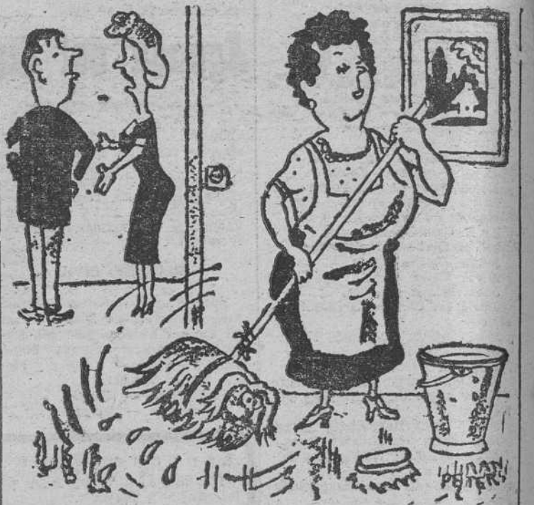
—¡No he visto a "León" en todo el día...