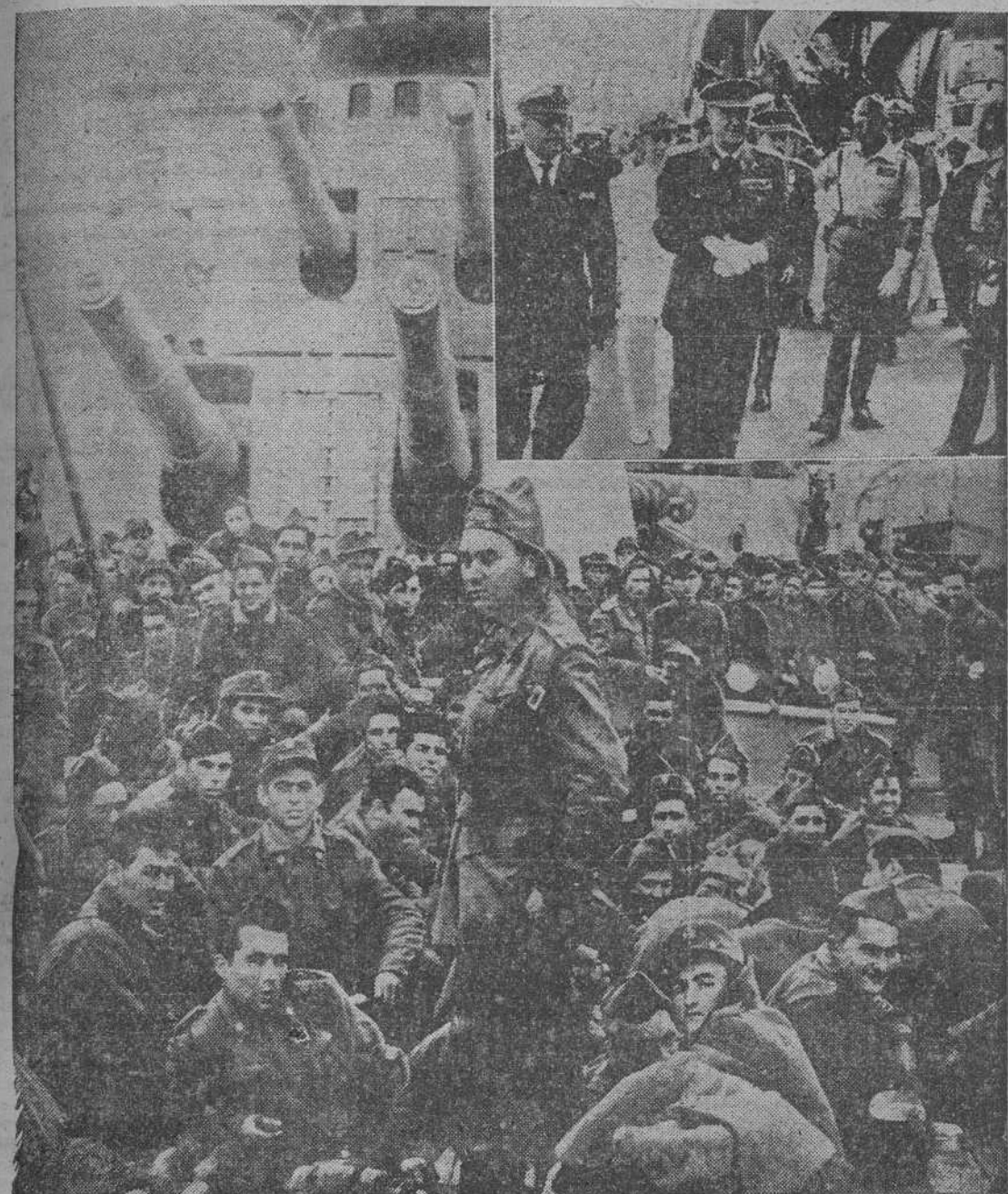
Rumbo a Sidi Ifni para reforzar las guarniciones que luchan contra los desmanes del Ejército de Liberación, el crucero "Canarias", comandado su cubierta de tropas de Infantería. En el ángulo superior derecho, el Gobernador Militar de Canarias visita a bordo del mismo buque a la valerosa hueste del Tercio.