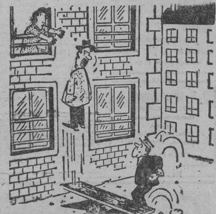
—A ver cuándo se decide el casero a poner el ascensor.