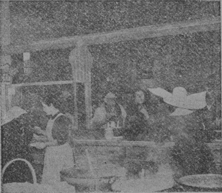
Un momento de la distribución de la comida, tarea en la que diariamente se ocupan las religiosas del benéfico establecimiento.

Doscientos comensales al día Bonos para proteger a los "pobres particulares"