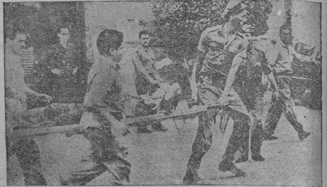
Después del intento de asalto al Palacio Presidencial, los camilleros transportan a uno de los heridos en la defensa.

La oposición de Mujal, el "leader" de los sindicatos, a la huelga general retrasó nueve meses el triunfo de FIDEL CASTRO