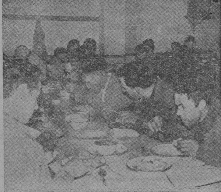
La hora del almuerzo, y buen apetito. Un ángulo del comedor general de la Cocina. en plena "actividad"

Nos acaban de decir que la Cocina llevaba una vida muy triste y sobre como se defiende eco-