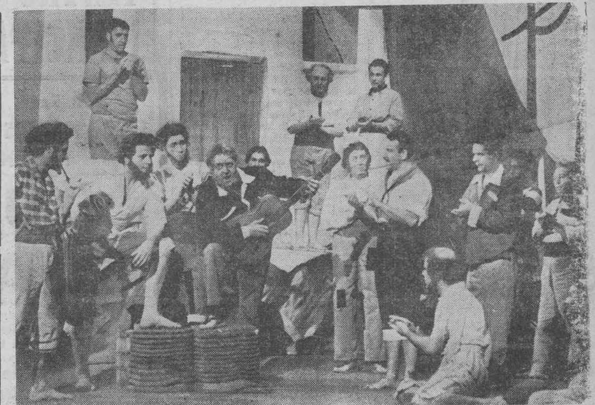
Una famosa escena de "Marina", la obra del maestro Arrieta, que será representada en la Quintana, por la compañía del Teatro de la Zarzuela de Madrid. Será una de las sesiones de Festivales de España que forman parte del programa de las Fiestas Patronales