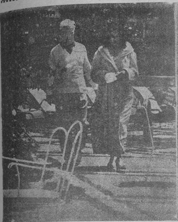
El actor cinematográfico Charles Chaplin y su esposa, después de bañarse en la playa de Formentor, adonde llegaron con sus seis hijos para pasar una temporada de tres semanas.

PALMA DE MALLORCA, 14.—Charles Chaplin "Charlot" ha empezado a disfrutar de una verdadera paz en su retiro de Formentor.