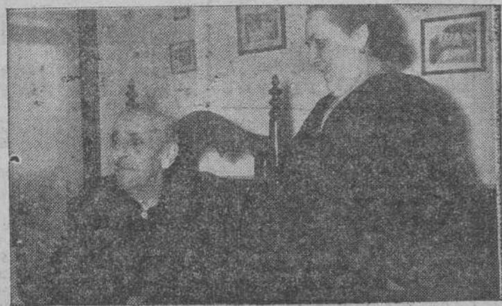
Una fotografía del poeta D. Ramón Cabanillas, con su hijo

El Ayuntamiento de esta localidad ha acordado constituirse en padrino de este matrimonio y los actos se celebrarán en la iglesia parroquial de Nuestra Señora de la Asunción.—Cifra.