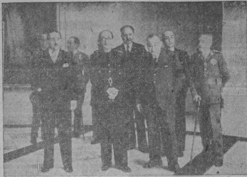
Con asistencia del Ministro de Educación Nacional han sido abiertas las nuevas salas del Museo del Prado en Madrid