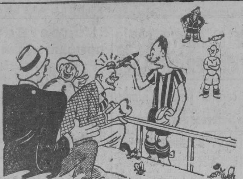
"A S" por Miranda

Más arriba de doce mil metros el cuerpo humano, considerado como un todo, no resiste, ni siquiera con máscara, ni el 10 por ciento del oxígeno que sirve para conservar la vida. Alemania piensa también en esto: en suministrar a sus aviadores en cámara a presión artificial dentro de la propia carlinga.