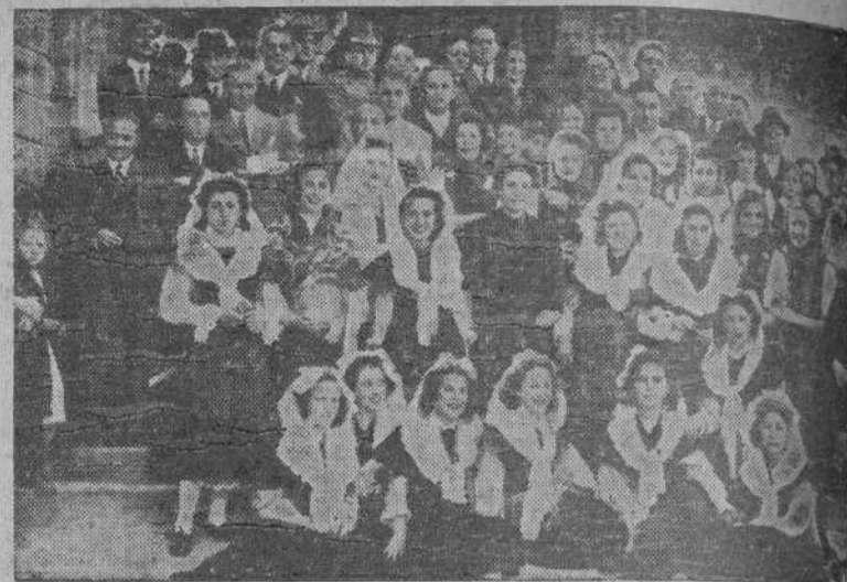
Jerarquías, representaciones y camaradas de la Hermandad de la Ciudad y el Campo que ayer celebraron la fiesta de San Isidro, Patrón de la Agricultura

Las camaradas de la Hermandad del Campo ofrecieron frutos y flores a su Patrono