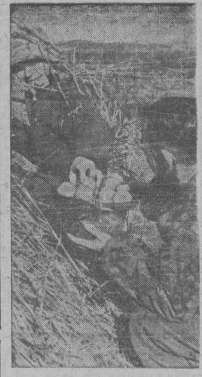
En un montón de heno se encuentra un puesto avanzado de observación, y grande es la alegría cuando un camarada llega hasta el entregándole un caso de acero lleno de este jugoso fruto.— Frente Sur de Italia