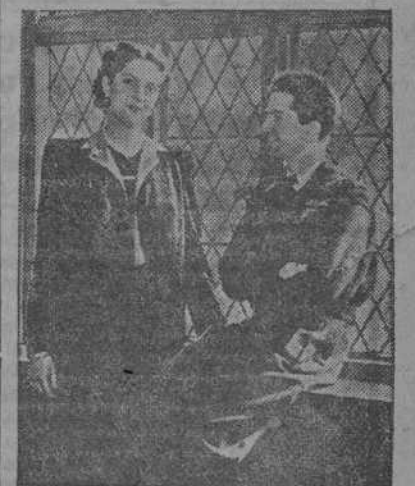
El depuesto Rey Pedro II, de Yugoslavia, y su esposa, la Princesa Alejandra de Grecia. Había asumido el Poder desde Londres, el 27 de marzo de 1941.

El Ideal Gallego publicará mañana un interesante capítulo de la correspondencia privada de Hitler y Mussolini. EL MEDITERRANEO, PREOCUPACION MAXIMA DE LOS ESTADISTAS es el título bajo el cual se revela que el Führer quería liquidar cuanto antes el problema mediterráneo para acometer, en la primavera de 1941, su proyecto de invasión de Inglaterra. Con este fin, envió al Sur de Italia al mariscal Milch con una potente flota aérea.