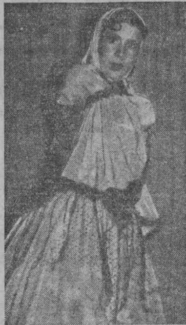
Encarnación López, "La Argentinita", que en el mundo elevó la categoría artística del baile español. Esta foto es de una de sus últimas actuaciones en Nueva York, donde falleció. Su cadáver será desembarcado hoy del "Marqués de Comillas" para ser trasladado a Madrid, y allí recibirá definitiva sepultura.

Procedente de la Habana y Nueva York, y conduciendo a bordo para La Coruña 141 pasajeros y 93 toneladas de carga general, llegó a este puerto ayer, a las ocho y cuarto de la noche, el trasatlántico "Marqués de Comillas". Para los puertos del Norte trae en tránsito 153 pasajeros.