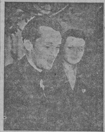
John Amery, acusado de alta traición, y condenado a muerte el 23 de noviembre

LONDRES, 19.—Esta mañana se ha cumplido la sentencia de muerte contra John Amery, hijo del ex Secretario de Estado para la India. John Amery, que contaba 39 años de edad ha sido ahorcado en la prisión de Wandsworth, por delito de alta traición a S. M. el rey Jorge VI. El anuncio oficial de que la sentencia había sido cumplida fué colocado a la puerta de la prisión a las 9,08 horas de esta mañana.—(EFE).