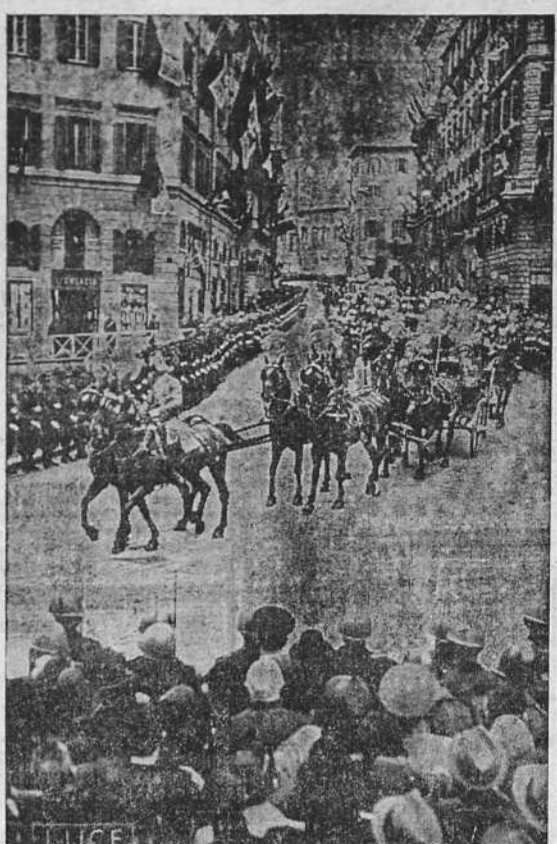
ROMA.—El cortejo real se trasladó a Montecitorio para la apertura de la XXX Legislatura y la inauguración de la Cámara de los Fascios y de las Corporaciones

LONDRES, 31.—El Consejo de Ministros se reunió de nuevo por la