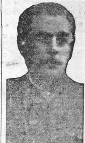
General Serrador, jefe de la Agrupación de Divisiones de Somosierra

Una Comisión especial de Falange Española Tradicionalista irá a Alicante