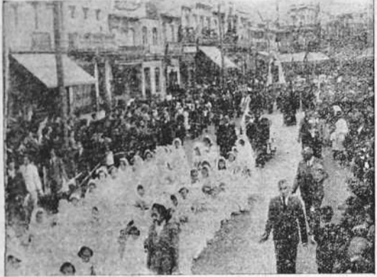
Dos aspectos de la procesión del Carmen, celebrada el domingo en La Coruña, con asistencia de gran número de fieles.