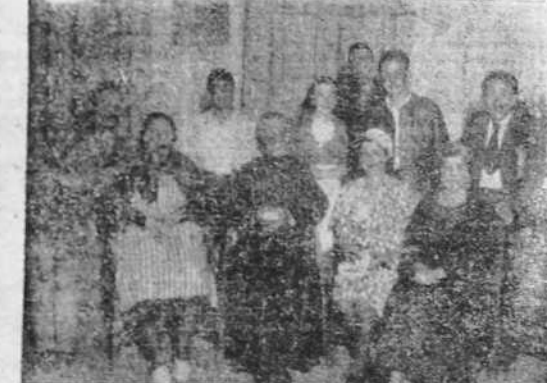
Cuadro artístico de la institución "El Angel de la Guarda" que representó en el Teatro Bacia Castro la comedia de Fernández del Villar, "La Franca".