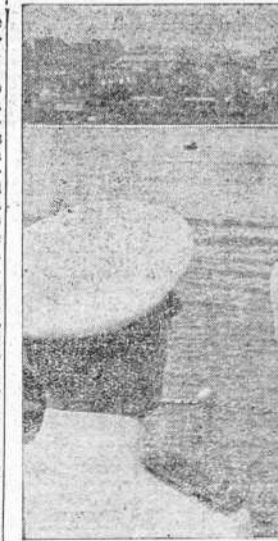
Momento en que el "Almirante Cervera" sale de la bahía de Santander, llevando a bordo al conde Ciano y al ministro de Defensa Nacional. El conde Ciano observa con los gemelos el bello aspecto de la bahía santanderina.

butaron al ministro italiano una fervorosa acogida. Pasó revista a las fuerzas que le rindieron honores y se dirigió a la capital. MALAGA 17.—Esta capital recibió con gran entusiasmo al ministro italiano. Las calles de la ciudad se hallaban engalanadas y habían sido levantados numerosos arcos. En uno de ellos se leía la siguiente inscripción: "El pueblo español se abraza a V. E. y le ofrece un pueblo de héroes y sabrá pagar en el momento oportuno la ayuda que recibimos". El conde Ciano depositó una corona de laurel en la tumba de los caídos. A las 17'30 después de pasar revista a las fuerzas, el conde Ciano se despidió de los ministros de Relaciones Exteriores, Gobernación y Justicia que acudieron al puerto, y montó en la canoa que le llevó al crucero "Eugenio de Savoia" anclado en la bahía con las demás unidades que le escoltaron en su viaje a Barcelona. Al despedirse de España, la multitud repitió los vitores a Italia, a España, al Duce y a Franco mientras las bandas de música interpretaban los himnos y las baterías disparaban salvas en su honor.