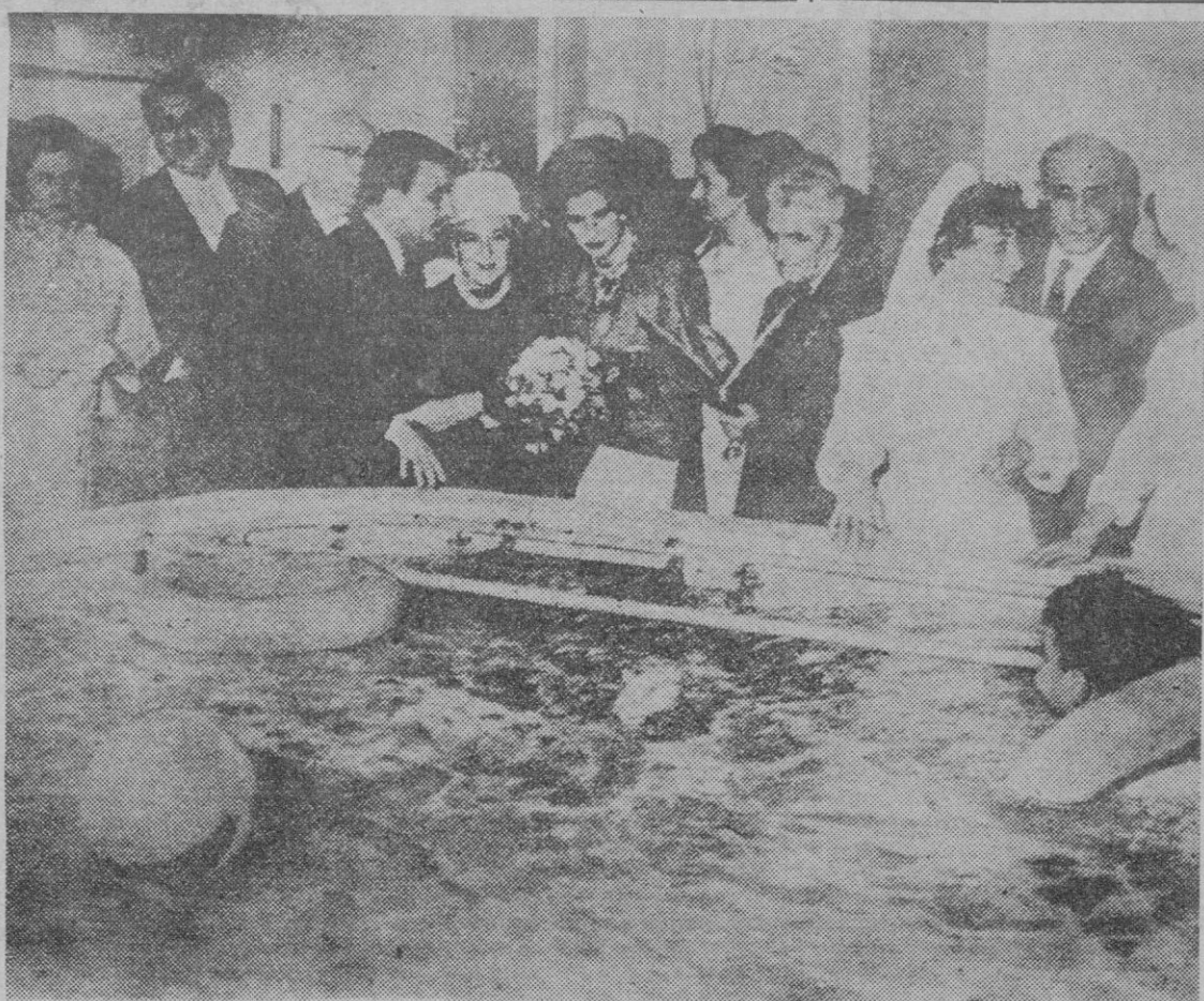
TARRASA. — Acompañada de la esposa del Ministro de la Gobernación y de otras damas, la marquesa de Villaverde aparece durante su visita a las instalaciones del Centro de Recuperación de Polio, que ha sido creado en esta ciudad.