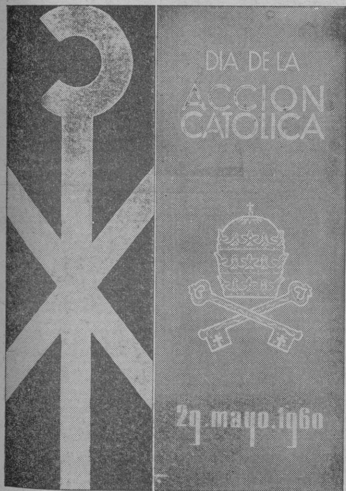
Cartel anunciador del Día de la Acción Católica y del Prelado.

Contrariamente a lo que se esperaba, los nombres de los nuevos ministros de Defensa y Justicia no fueron anunciados antes de la ceremonia. Se espera que la cartera de Defensa, según los círculos políticos, sea desempeñada por el príncipe Hassan, quien además de viceprimer ministro es jefe de las fuerzas armadas.—Efe.