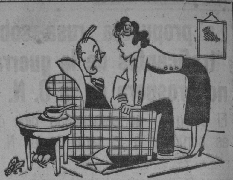
NOTA, por MIRANDA

CIUDAD DEL VATICANO 23.—Han llegado los obispos de León y Granada para efectuar la visita "ad limina". Mañana sale para Madrid el Obispo de Zamora. El Arzobispo de Zaragoza prolongará su estancia en Roma. Se espera la llegada del Obispo de Vitoria. EFE.