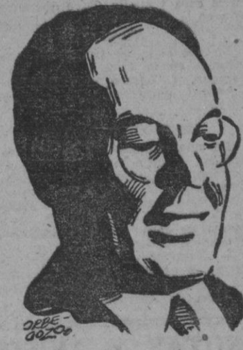
ENRIQUE HERTZOG Presidente de Bolivia

Más tarde, el presidente de la Argentina colocó la primera piedra de la Escuela que la Argentina regala a Bolivia, de acuerdo con la voluntad de Belgrano, expresada en su testamento. Inmediatamente después, Perón, acompañado de su esposa y del presidente boliviano, salieron para Sanaña. La Cámara de los Diputados ha enviado un cordial mensaje de saludo al general Perón con motivo de la visita de éste a territorio boliviano.