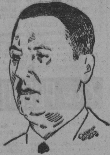
JUAN PERÓN Presidente de la Argentina