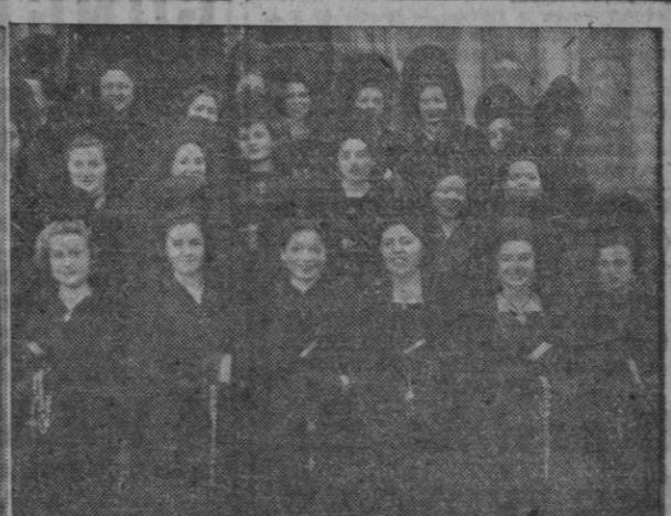
Con motivo de las festividades del Jueves y del Viernes Santos, y aprovechando el espléndido tiempo, de sol primaveral, fueron muchas las jóvenes coruñesas que lucieron la mantilla española en su visita a los Monumentos y asistencia a las procesiones. He aquí algunas bellas muchachas que pusieron en las calles de nuestra ciudad la nota sobria, de hondo sabor español, del clásico atuendo femenino de Semana Santa, rica tradición que no desaparece de nuestro pueblo.