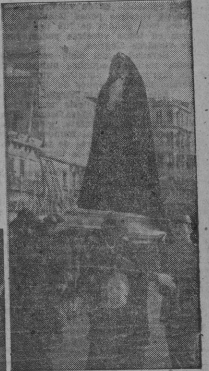
La Virgen de la Soledad, nazarenos y penitentes que figuraron en la solemne procesión del Encuentro que recorrió las calles coruñesas en la mañana del viernes

Catorce mil millones de dólares para la defensa de los EE. UU.