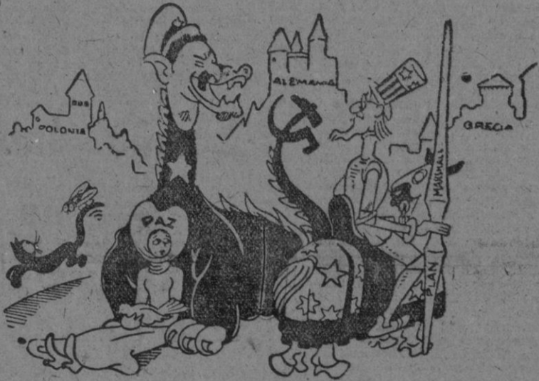
NO ES CUENTO, por Miranda "La princesa secuestrada o castillos en el aire"

Todos los actos de la Semana Santa han revestido gran solemnidad demostrando el gran fervor religioso de todos los españoles.—(CIFRA).