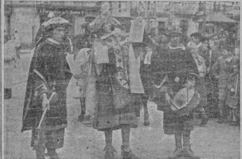
Lectura del pregón de las fiestas de San Fernando, organizadas por el Frente de Juventudes

Continuando los festejos organizados por la Delegación provincial del Frente de Juventudes en honor de su celestial Patrono, San Fernando en la mañana de ayer recorrió las calles coruñesas una vistosa comitiva a la usanza medieval. Abría el cortejo un clarín a caballo que precedía a dos heraldos: marchaban a continuación dos escuderos portando lanzas y escudos, en cuyo centro iba el pregónero, y cerraban la marcha tres reyes de armas en sendos corceles, seguidos de sus correspondientes cortejos. El itinerario de la comitiva fué el de las calles de Plaza de Pontevedra, Juana de Vega, Cantones, Obelisco, Marina, Gobierno Civil, Riego de Agua, Real, Rúa Nueva, San Andrés, Plaza de Pontevedra y regreso al punto de partida.