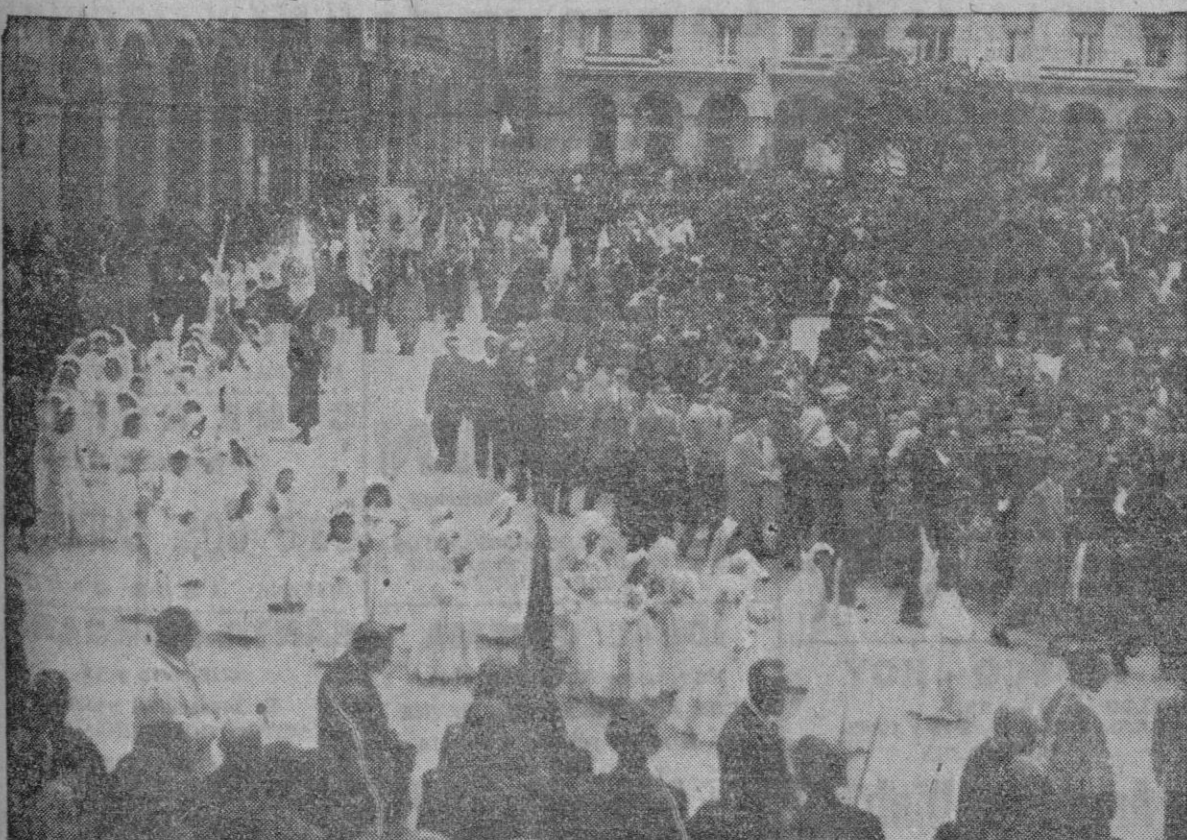
La tradicional y solemne procesión coruñesa del Corpus Christi a su paso por la Plaza de María Pita

los yugoslavos. Cita varios incidentes graves, como las detenciones en masa en Citanova, después del entierro de un italiano asesinado; los procesos de religiosos y sacerdotes católicos, en los que no se ha permitido la presencia de corresponsales extranjeros, y el "no frecuente uso" de armas de fuego por los guardafronteras yugoslavos.