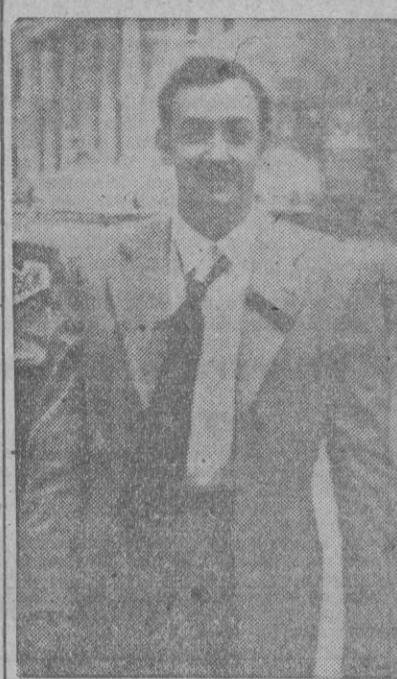
JORGE NEGRETE, EN MADRID

En la mañana del lunes ha llegado a Madrid el gran artista mejicano Jorge Negrete, al que le ha sido dispensada una, apoteósica acogida por parte de sus innumerables admiradores