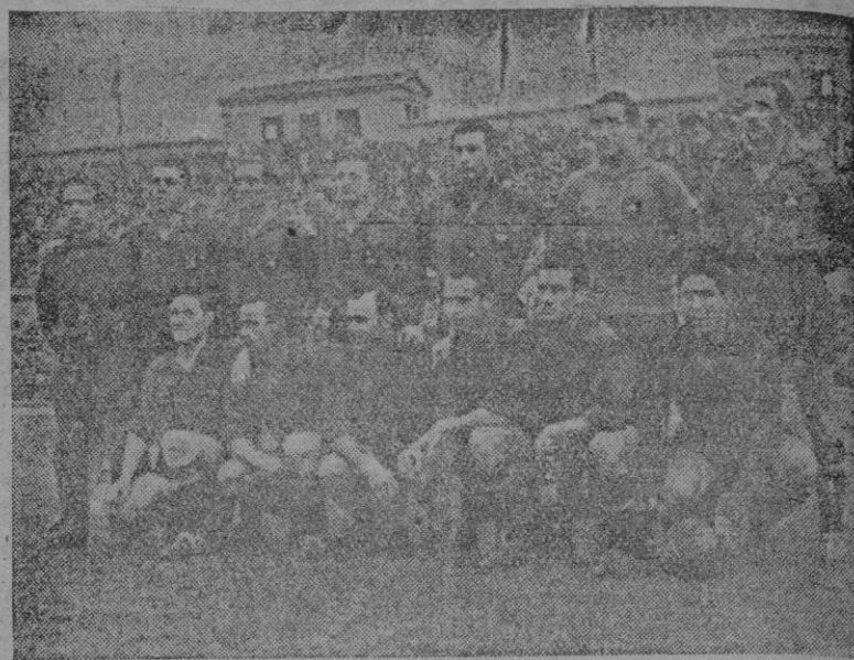
He aquí la formación del equipo español que batió por la mínima diferencia a la selección irlandesa, por dos tantos a uno. Con este resultado, los cinco encuentros jugados entre ambas selecciones nacionales dan dos victorias para cada equipo y un empate. (Foto CIFRA).