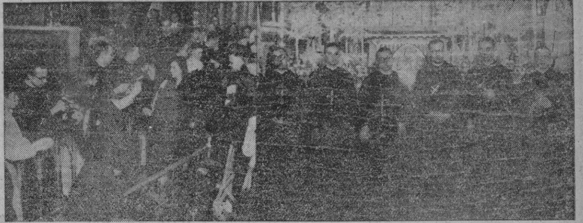
El domingo se celebró por la mañana en la iglesia de los Jesuitas, y después en el salón del Cine Avenida la despedida a los misioneros que marchan a Anking, en la China. Millares de devotos asistieron a la misa y se acercaron a la Sagrada Mesa El acto de homenaje y despedida, al que asistió numeroso público, resultó también fervoroso y solemne. En nuestra información gráfica se recoge el acto de besar el Crucifijo de los misioneros, y el grupo de los jóvenes sacerdotes que salen para la Misión en China.