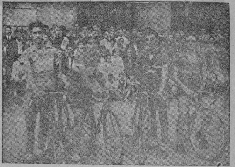
Los vencedores de las pruebas ciclistas celebradas ayer tarde en la Plaza de María Pita