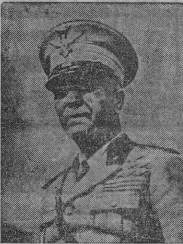
PARIS, 9.—Noticias no confirmadas recibidas de Roma dan cuenta de que el mariscal Badoglio, que sustituyó a Mussolini en la jefatura del Gobierno italiano, se ha retirado a un convento de franciscanos.—(EFE).