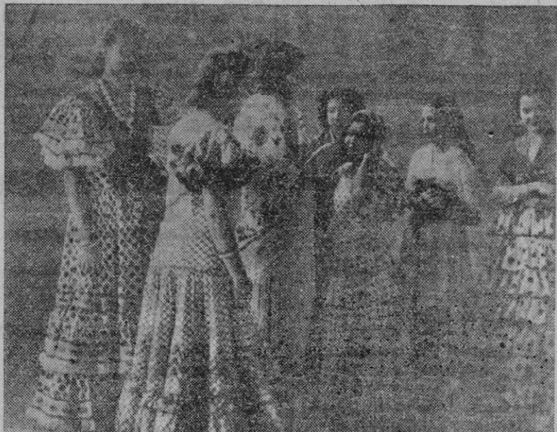
MEXICO.—Con motivo de la festividad de Santiago Apóstol, la colonia gallega celebró romería, vistiendo la mayoría de las muchachas trajes de Galicia y Andalucía. Un grupo de las que alegraron la romería con sus cantos.