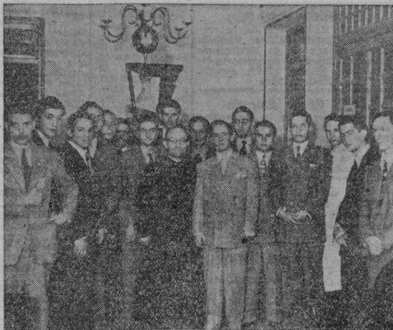
MADRID.—He aquí el grupo de estudiantes ecuatorianos recién llegados a Madrid, que forman parte de la representación de El Ecuador en la Peregrinación Mundial a Santiago de Compostela.