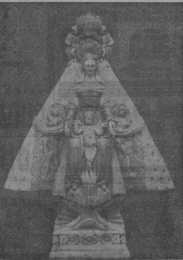
La imagen de la Virgen de los Desamparados tallada y policromada por Asorey

Es la ofrenda que los residentes en la ciudad del Teucro y en Buenos Aires hacen a la República Argentina. La iniciativa ha correspondido al presidente de la Casa