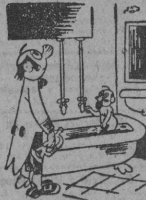
—Bautista: en cuanto vea usted que me alejo de la orilla, avíseme con nn toque de cornetín.