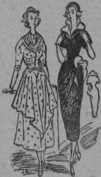
Por BLANCA DE LEBARIO

La Alta Costura acusa un gran interés por las líneas generales de la silueta; busca, sobre todo, el efecto del conjunto, la armonía y los juegos ingeniosos de los detalles; trata, en una palabra, de ejercer una agradable impresión que, en una nueva colección, es de extrema importancia. Todo es simétrico, desigual y sin control, cada modista interpreta como le place, los recogidos de las faldas, los abotonados, la forma de las esclavinas y la anchura y largura de los vestidos; las túnicas son irregulares, los drapeados sobre un solo costado; volantes en espiral "panneaux" aplicados por detrás sobre faldas-tubo, manteletas con "capulet" y abrigos-capas con manga corta. Los abrigos de vestir son mayormente anchos, con amplias mangas semi-largas, o de tres cuartos, adoptan colores preciosos y florales, el azul del jacinto, el malva de la videta de Parma, el cremado de la rosa de té y el rojo del granado.