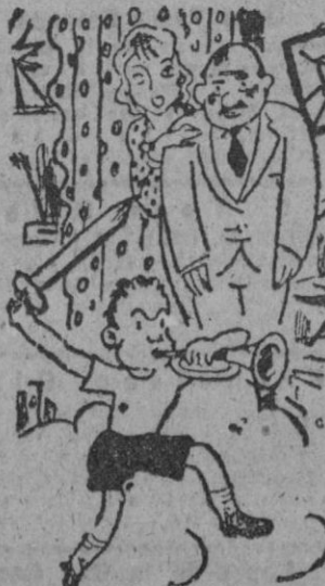
—¡Y pensar que pagué diez mil dólares a los raptores para que me lo devolvieran!

vés de la frontera franco-belga. Tanto llegó a lucirla que un aduanero, curioso por conocer el mecanismo articulado, metió las narices en aquella propiedad de Meubee y vino a dar con unos fajos de billetes belgas, falsificados, que, quizás por descuido, había dejado allí dentro el fabricante del aparato. Lo malo es que los de la Aduana pensaron lo peor y dieron con nuestro cojo en la cárcel, pierna artificial incluida.