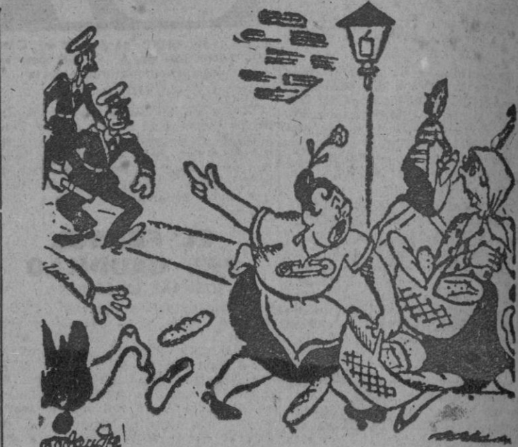
"LA BAJA DEL PAN", por Miranda —¡"A-real", "a-real"! ¡Que vienen los guardias!