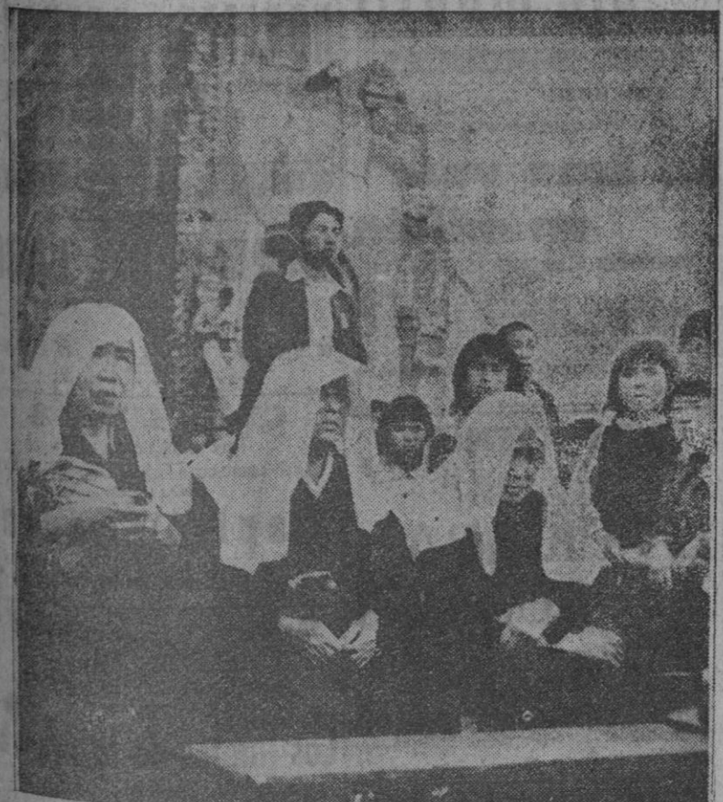
En las ruinas de la iglesia de Urugami, destruida por la bomba atómica de Nagasaki, tres ancianas japonesas elevan sus plegarias durante la misa que se celebró en el cuarto centenario de San Francisco Javier

de Galicia de Buenos Aires don Agustín Blanco, quien visitó Galicia el año pasado. (CONTINUA EN SEXTA PLANA)