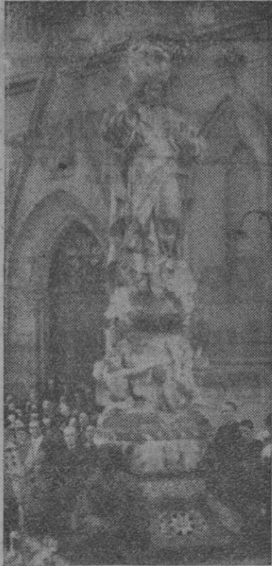
La sagrada imagen del Corazón de Jesús que ayer recorrió procesionalmente las principales calles coruñesas (Información en la página nueve)