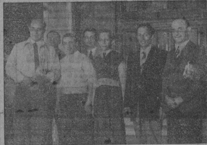
Tres artistas franceses que actúan en uno de los Circos instalados en La Coruña, y que ayer fueron a saludar y desear buena suerte a sus compatriotas, los jugadores del Racing de París