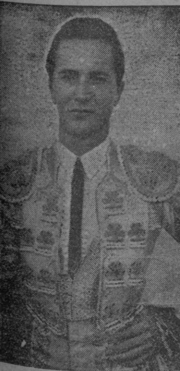
LUIS MIGUEL DOMINGUIN una de las figuras del cartel de hoy en La Coruña