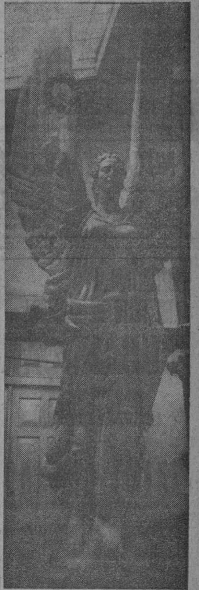
En quinta plana publicamos un reportaje sobre el monumento a los ferrolanos muertos en la guerra de Africa. En la foto puede apreciarse la hermosa figura de la Victoria, modelada por Asorey en su estudio para ser fundida en bronce.