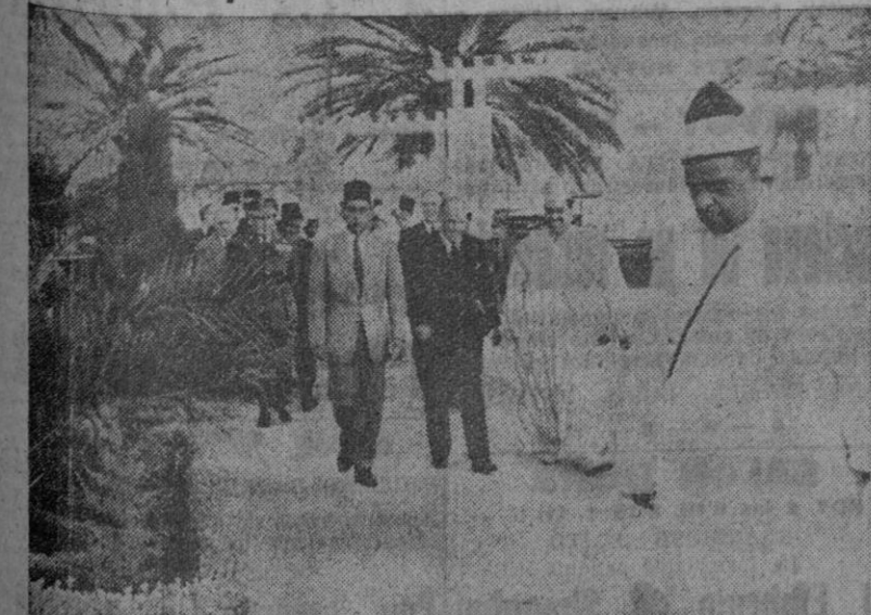
TETUAN.—El hijo del Sultán de Mar ruceos, acompañado del Alto Comisario, Teniente General Varela, de S. A. I. el Jalifa y otras personalidades durante su visita a la Delegación de Educación y Cultura