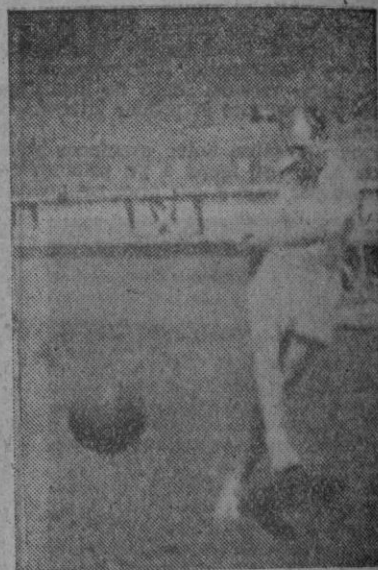
Uno de los futbolistas parisienses durante el entrenamiento con balón que realizaron en el Estadio de Riazor

En la mañana de ayer y durante una hora estuvieron entrenando en el Estadio los jugadores del Racing de París. Hicieron ejercicios gimnásticos para desentumecer los músculos y luego le dieron a la pelota. Y por cierto magníficamente. Grandes dominadores del "cuero" hicieron con él verdaderos malabarismos, mostrándose, asimismo, como consumados atletas. En fin, que causaron gran impresión. Tanta, como a ellos el Estadio y la Copa que se exhibe en una joyería de la calle Real. Por la tarde estuvieron en el Ayuntamiento, donde visitaron algunas de las dependencias, exteriorizando su admiración por la suntuosidad del Palacio Municipal. Después recorrieron la ciudad, siendo tratados en todas partes con gran simpatía.