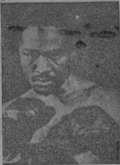
Ezzard Charles, vencedor de Joe Walcott, y campeón del mundo de todas las categorías