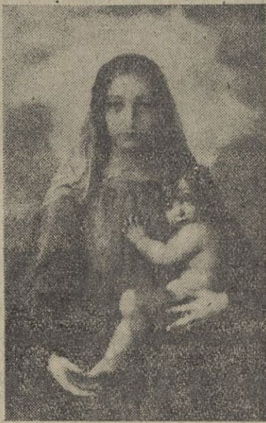
"Virgen con el Niño", óleo de Angel Espinosa

el de Benavente, con empaque literario; un sencillo detalle da la clave del insigne dramaturgo como autor y como actor. Sobre una silla, aparece el traje del Crispín de "Los intereses creados": calzón corto, capa y chambergo de larga pluma, vestimenta del más filósofo, práctico y bribón de cuantos criados en el mundo han sido. Y el último es un autorretrato clásico, entendiendo por tal la sencillez y la claridad en la ejecución. Es realmente magnífico, digno de ser firmado por Vicente López.