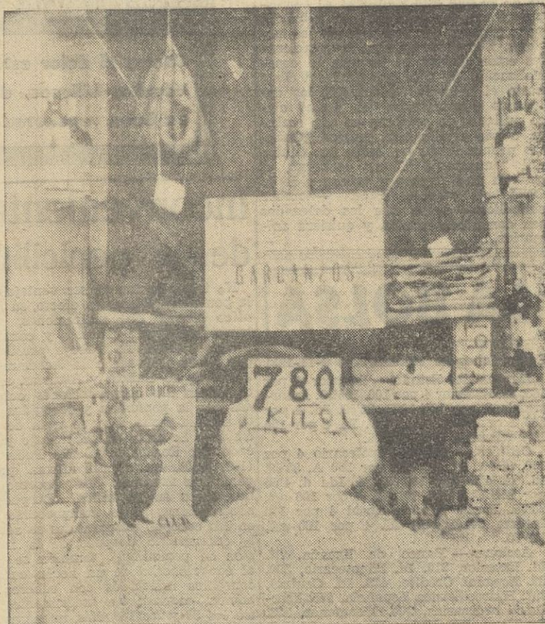
Un ultramarinos dedicado a la venta de garbanzos mejicanos

Asimismo se decide rogar a todos los consumidores de manufacturados de abacá o sisal, que notifiquen al Ministerio de Comercio sus necesidades anuales, al objeto de poder coordinar debidamente las importaciones, con el plan de trabajo para el próximo año al objeto de evitar cualquier desconexión entre la producción y las disponibilidades de materias primas.