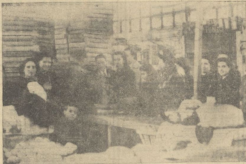
Venta de huevos en el mercado de la Plaza de Lugo

Ya no constituye para nadie un secreto que el Estado español, a través de su joven y dinámico Ministerio de Comercio, está dispuesto a librar su definitiva batalla contra la carestía, fenómeno que en ocasiones es hijo de la escasez y en otras del egoísmo desatado, de un acucioso egoísmo que invadió determinados sectores sociales anteponiendo al concepto comercial el principio inhumano del lucro hecho norma. Va, pues, camino de acabarse con cuantos logrosos asfixian o intentan hacerlo, a las clases españolas económicamente débiles y ello bien merece ser comentado. Mas, como quiera que este colosal problema, por su magnitud, sería difícil de exponer al lector dentro del corto marco de un breve comentario, nos limitaremos a enfocarlo desde el plano local, que quizá por más próximo a nosotros, eleve el interés de cuantos, casi todos los ciudadanos, viven hoy más atentos a la despensa que a otros problemas de menor cuantía.