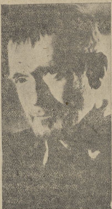
Pierre Fresnay, en su maravillosa caracterización de San Vicente de Paul

He aquí, pues, que con ser tan estimable la parte técnica, resalte secundaria ante el desarrollo argumental. Esto no quiere decir, ni mucho menos, que Rafael Gil y sus colaboradores hayan dejado de aprovechar cuantos ángulos de visión o de sonoridad ofrecía la temática general a los efectos especiales, fondos musicales o restantes resortes cinematográficos. Porque si en un cine andeble la técnica puede más que el asunto, hasta reducir éste a un aspecto puramente secundario, cuando se trata de temas del volumen de las apariciones de Fátima, los recursos técnicos nada cuentan ante la realidad del milagro o frente al valor