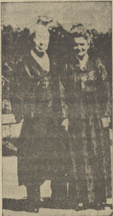
Syngman Rhee, Presidente de Corea del Sur, acompañado de su esposa. Para Rhee, el pacto de paz con los comunistas supondrá la sentencia de muerte para la nación coreana.