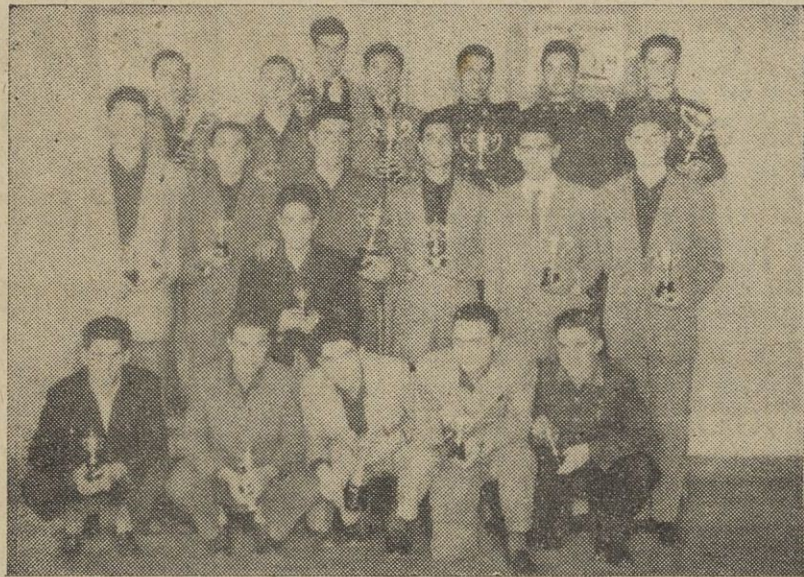
Vencedores en las distintas pruebas deportivas del F. de Juventudes, con los trofeos que les fueron entregados