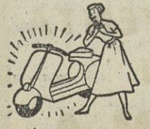
y acuda a recoger su premio.

Los Chocolates que gustan mucho... mucho... mucho.