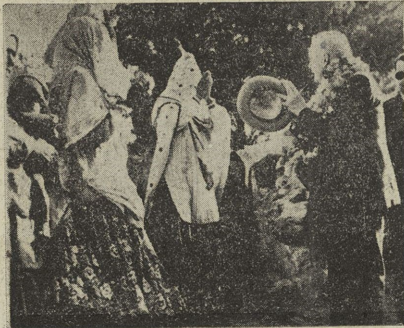
El Presidente del Canadá, Louis St. Laurent visita varias localidades indias del país