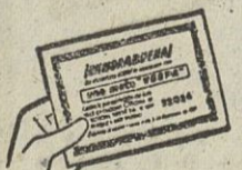
Compruebe si contiene un «Vale Premiado»