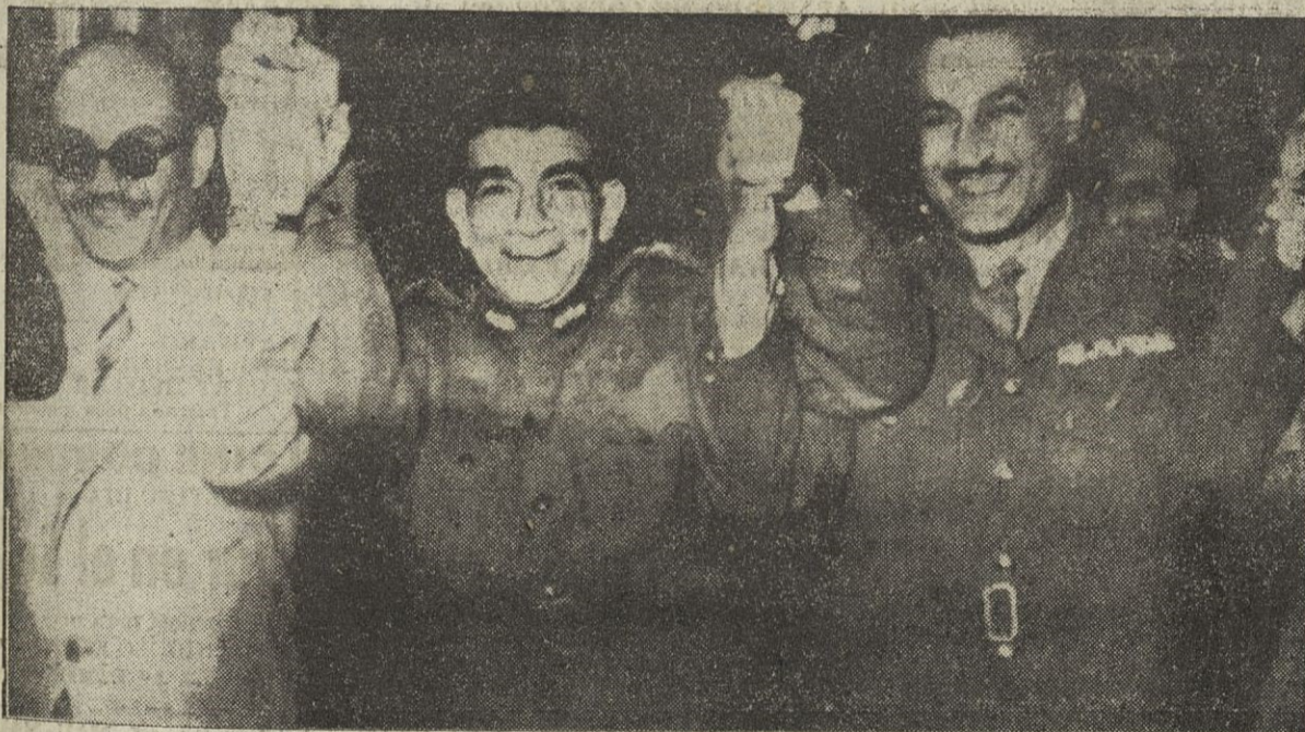
El comandante Salah Salem, Naguib y Nasser se cogen de la mano para mostrar la renacida unidad existente entre los políticos egipcios después de los acontecimientos ya conocidos.

EL CAIRO, 3.—En una entrevista exclusiva a la agencia United Press en el Palacio Abdin, el Presidente Naguib ha dicho que no guarda rencor a los que la semana pasada lo sacaron de la Presidencia y luego lo repusieron en ella. Afirmó que su misión es pacífica y que no se ocupa de él mismo, sino únicamente del bien de Egipto.