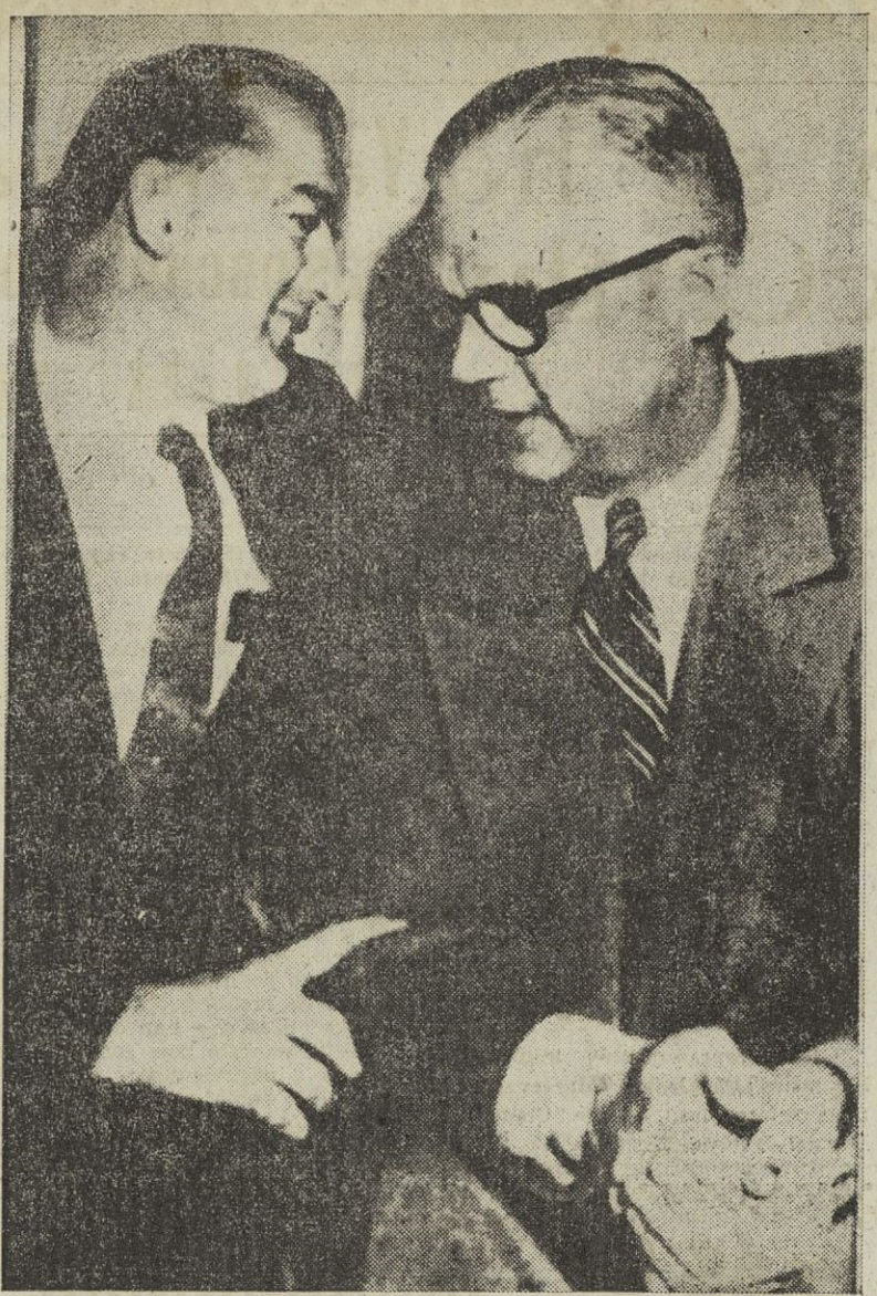
La radiofoto muestra al senador Mac Carthy y al secretario del Ejército, Robert Stevens, que se enfrentaron en enojosa polémica con motivo de los graves cargos hechos por el senador acerca de la infiltración comunista en el Ejército norteamericano. A pesar del gesto amigable, ambas personalidades se inereparan mutuamente para terminar coincidiendo en su anticomunismo.