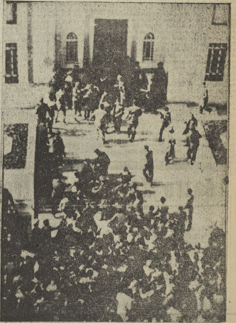
Dieciséis personas resultaron muertas en los disturbios registrados en Siria. La telefoto muestra a la policía luchando con los revoltosos en la entrada principal del Parlamento.