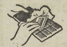
Vea el interior del envoltorio.