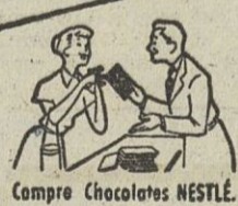
Compre Chocolates NESTLÉ.

Mire dentro del envoltorio antes de tirarlo... ¡Su vale puede estar premiado!