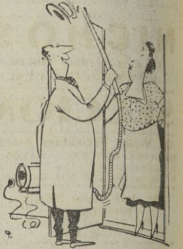
—Señora: le presento el último modelo de aspirador.