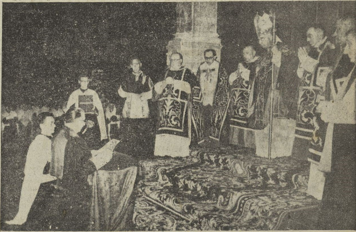
El ministro de Justicia, después del solemne pontifical que ofició el señor Arzobispo de Valencia en la Catedral, dando lectura al voto de la Abogacía y Magistratura españolas, propugnando la declaración dogmática de la meditación universal de María. (Servicio Edica, por Vidal).