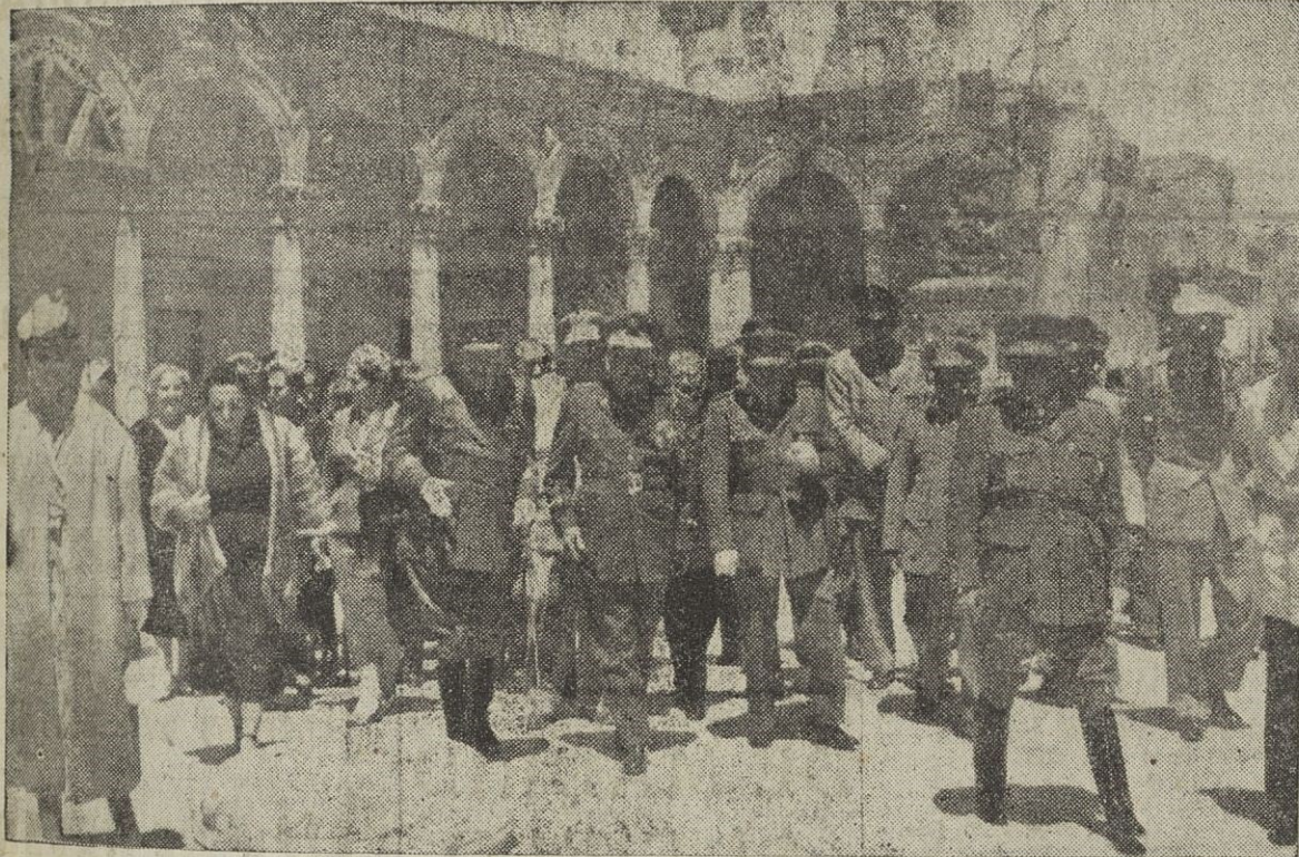
El Generalísimo Trujillo, durante su visita a las ruinas del Alcázar de Toledo, escucha las explicaciones que acerca del asedio y la defensa le da el glorioso teniente general Moscardó.

Estimó el señor Carter muy necesarios y fundamentales por su contenido y significación los centros de higiene rural y centros maternos de urgencia creados por toda España, por el Ministerio de la Gobernación y varios de cuyos centros ha visitado durante su estancia en esta provincia.