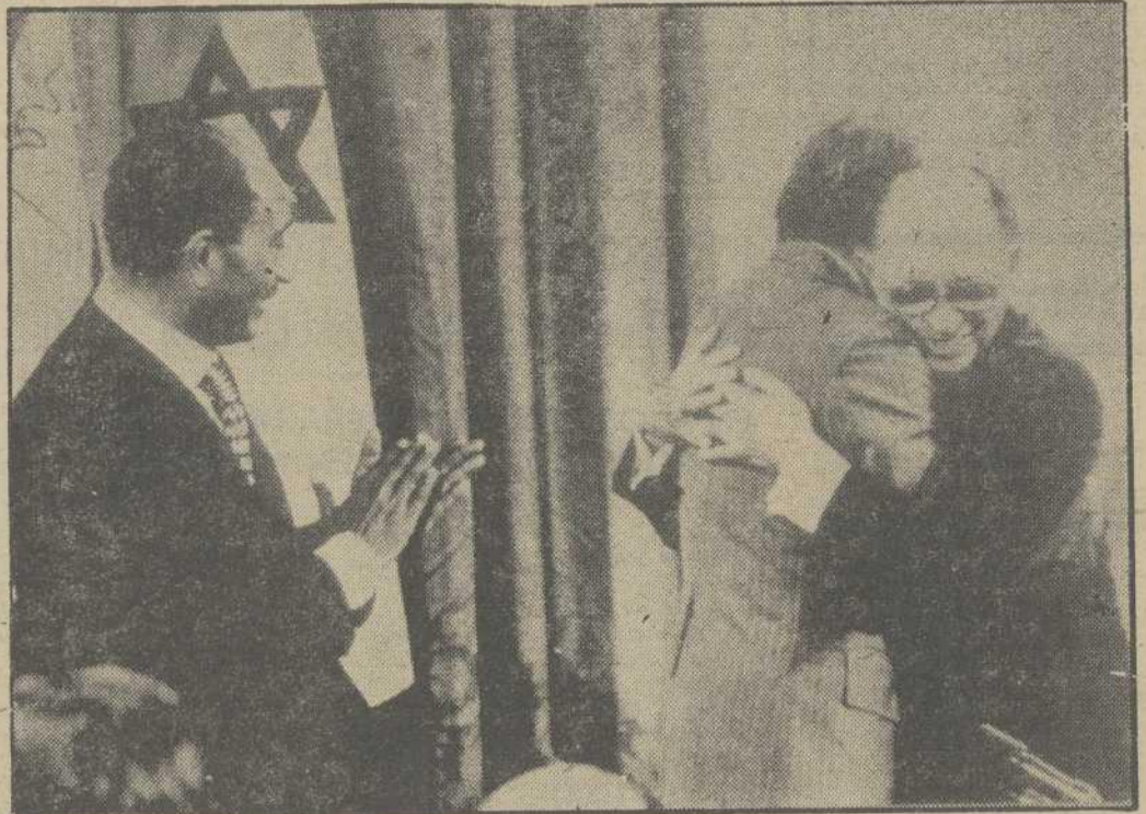
La "cumbre" de Camp David ha devuelto, después de trece días de conversaciones, la reconciliación entre Egipto e Israel, pero todavía no ha llevado la paz a Oriente Medio. Egipto e Israel acordaron seguir con las negociaciones sobre la base de dos documentos "marco" que se esperan otorguen la paz definitiva al conflictivo Oriente Medio. En la foto, Carter y Begin se abrazan mientras Sadat aplaude.