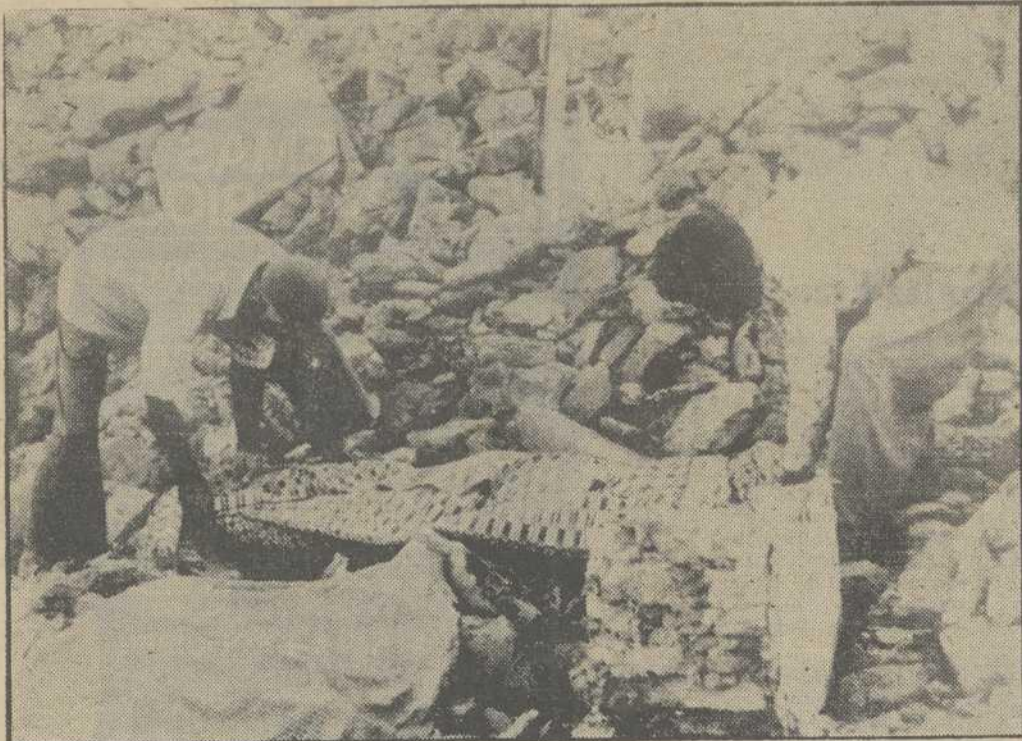
A dieciséis mil se eleva el número de víctimas a causa del terremoto registrado en la zona de Tabas en Irán. Hasta el momento, y pese a los esfuerzos realizados, han sido enterradas unas cinco mil personas en esta ciudad, muchas de ellas en fosas comunes. Los cadáveres se alinean por las calles a la espera de ser identificados. A este elevado número de víctimas hay que unir ahora nueve más al estrellarse un avión con base en Teherán que trataba de llevar suministros a Tabas, protagonista principal de la catástrofe.

Presunto ETA herido por la policía en Behovia