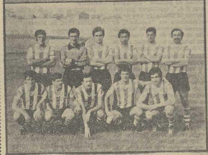
Los equipos del Milagrosa y Celtiga posaron para Riaño, momentos antes de comenzar el encuentro