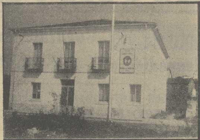
PUEBLA DEL BROLLON.— (De nuestro corresponsal, CASANOVA).