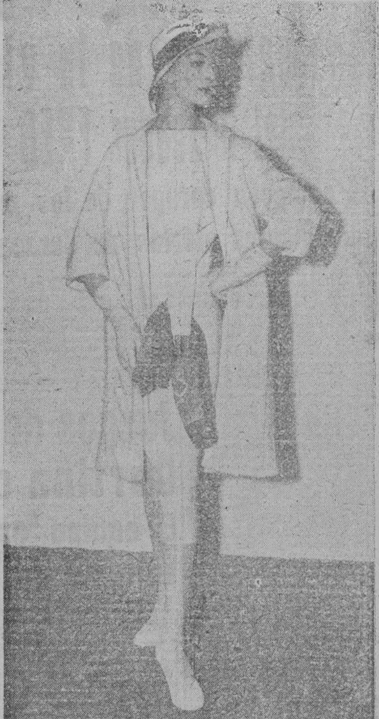
Traje confeccionado en tejido de lana, liso, y chaquetón también blanco, en tejido grueso. Ha sido presentado por Digby Morton en una exhibición del Hamilton House, en Londres