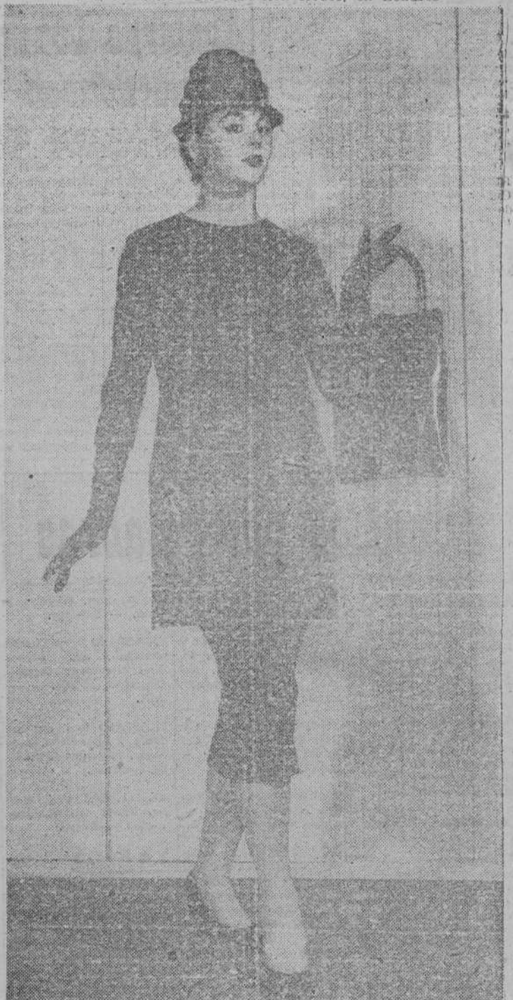
En un desfile de modas celebrado en Londres se ha exhibido, entre otros, este modelo. Es un conjunto compuesto de falda ceñida y especie de blusón amplio, largo, cerrado y liso. La sobriedad del traje va compensada por la extravagancia del sombrero