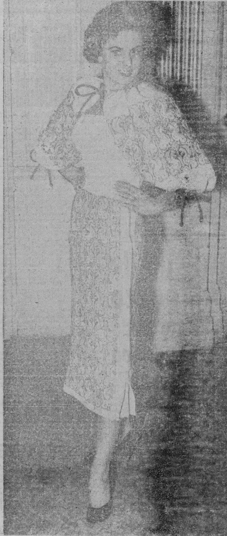
Este modelo de falda y chaquetilla drapeada lleva el nombre de «Dragón». Ha sido realizado por la modista Gruenfeld, de Florencia, y presentado en una exhibición en Londres