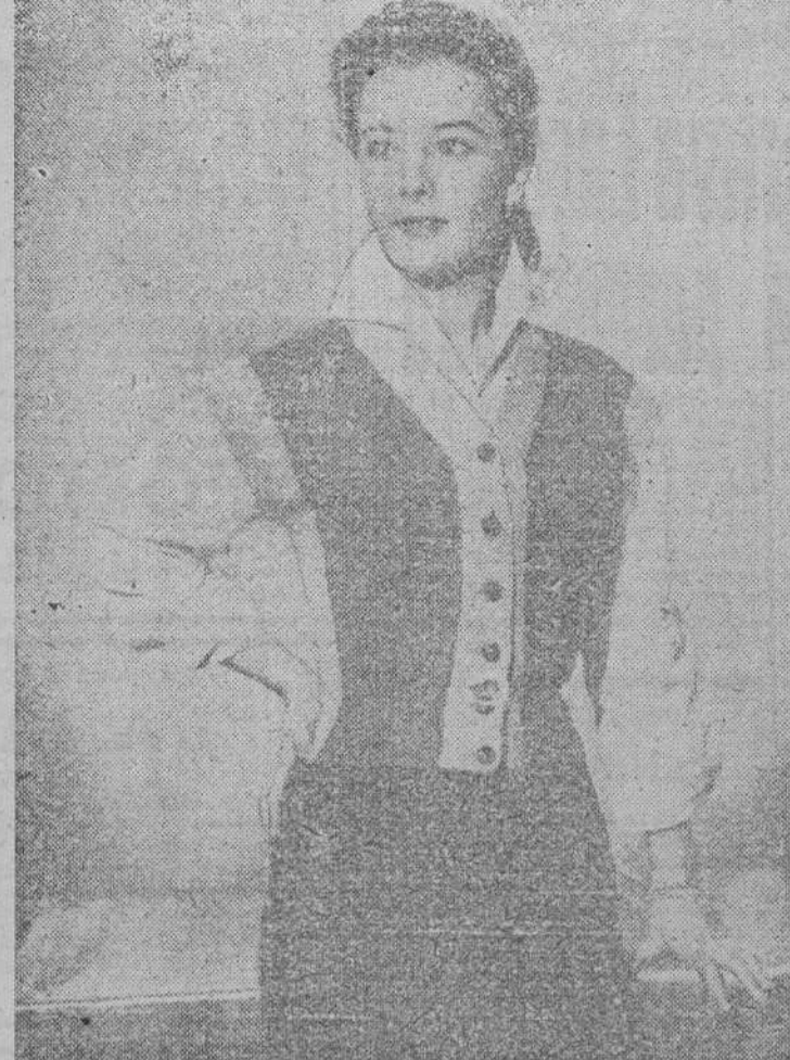
Falda lisa y oscura, blusa camisera confeccionada en popelín blanco y chaleco en dos tonos. Es una de las creaciones presentadas en Londres para la próxima primavera