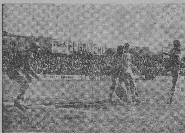
Momento de apuro ante la portería del Alavés