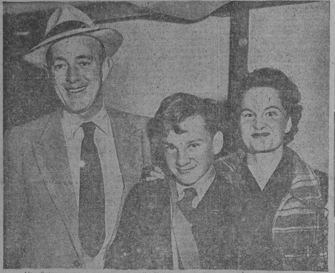
Alec Guinness, con su esposa y su hijo Matthews, de quince años, que también se ha convertido al catolicismo

UNO de los más famosos actores británicos de la escena y de la pantalla acaba de convertirse al catolicismo.