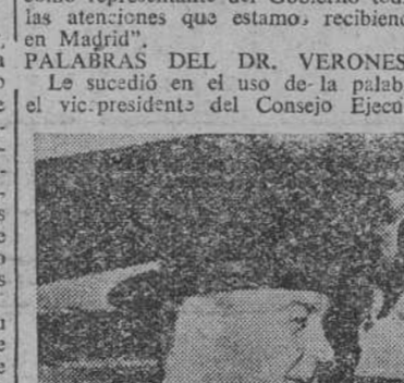
El director general de la UNESCO, Mr. Evans, que presidirá las reuniones del Congreso de dicha organización cultural, que por vez primera se reúne en la capital de España