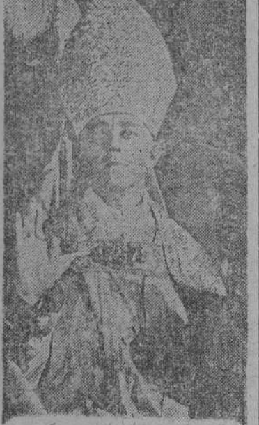
En «El prisionero», película inspirada en el drama del cardenal Mindszenty