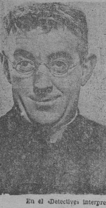
En el «Detective» interpretó un papel de sacerdote