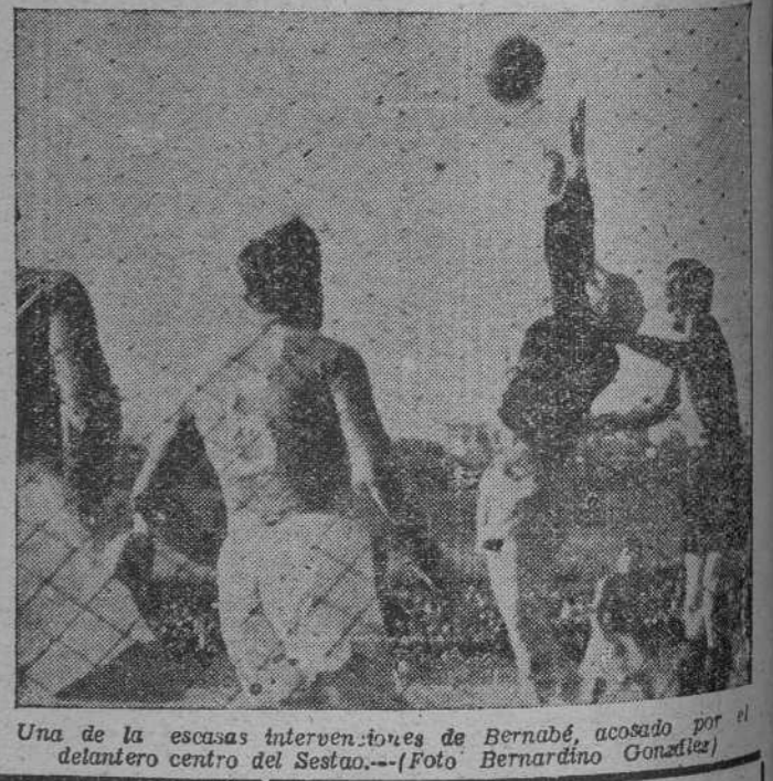
Una de las escasas intervenciones de Bernabé, acosado por el delantero centro del Sestao.