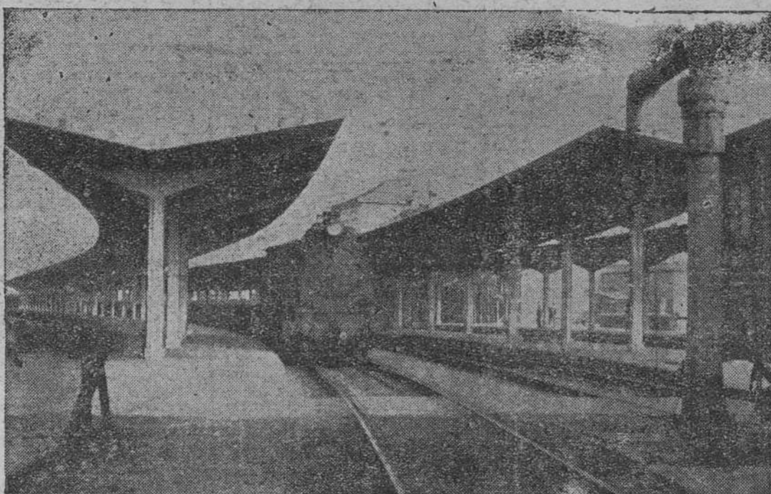
ESTACION EMPALME, DE ORENSE, ENTRONQUE DE LAS MÁS IMPORTANTES LINEAS FERROVIARIAS DE GALICIA.

fué puesto ayer en servicio A las 11 y 10 de la mañana partió un mercancías de 26 unidades con un total de 439 toneladas de carga