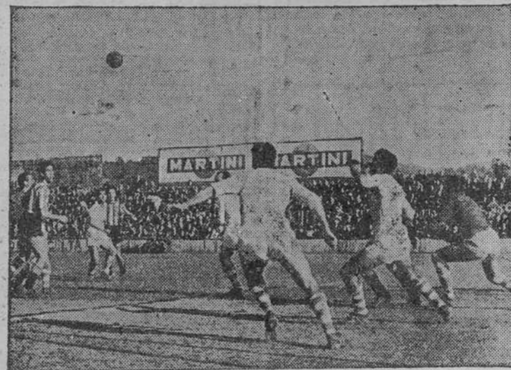
Un apuro en la meta céltica.

ros 45 minutos. El segundo gol del Celta, realizado por él, ha sido igualmente maravilloso. El debutante Cortizo acusó el nervosismo natural de su presentación.