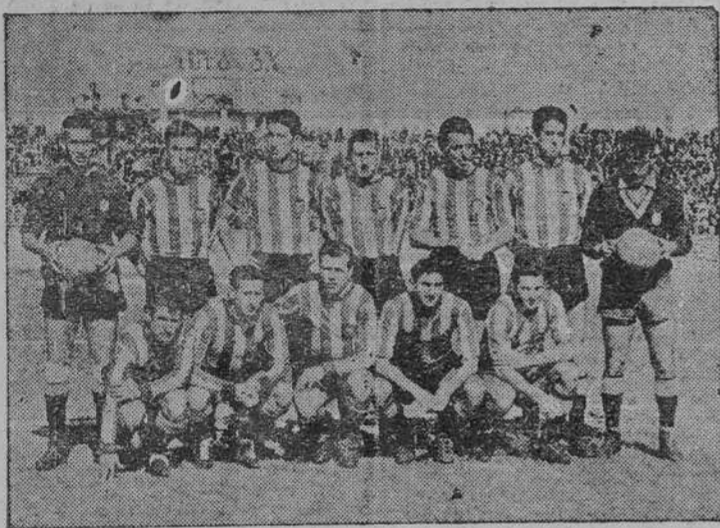
Equipo del Valencia, que ayer fué vencido por el Celta con lo que terminaron los "cusos" en Balaídos.

VIGO, 14. (Por teléfono).— Ayer, en Balaídos, con una entrada aceptable, se jugó el decisivo encuentro Celta-Valencia, de cuyo resultado dependía en gran parte la permanencia del equipo vigués en Primera División. Su triunfo, contra un enemigo tenaz y entero, cuya decisión en la pelea hacen superior "estímulo" fuera de serie, no fue fácil ni cómoda. El Celta derrochó espíritu combativo en los primeros 45 minutos, acosando al equipo levantino, que dicho sea de paso, sacó unas camisetas pintadas de los colores rojos y amarillos.