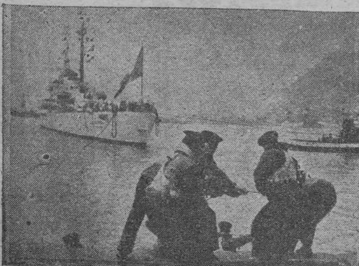
En el puerto de Barcelona, durante las maniobras de ataque del buque insignia "Abruzzi", que, al frente de la Flota, ha llegado de visita a nuestro país.

Diez minutos más tarde tenía prevista la salida de Zamora de otro tren de mercancías con destino a Orense, el 8.642, que se cruzaba con el que partió de esta capital, en la estación de Zubela, de la provincia de Zamora. La distancia cubierta por ambos trenes es de 249 kilómetros que separan a esta capital de la zamorana.