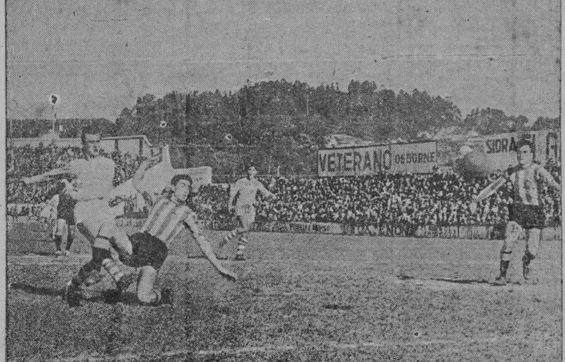
Mauro remata imparablemente el primer gol.

La presión pamplonica cada vez se hace más fuerte y de un momento a otro se ve a Eizaguirre, inquietando a Eizaguirre, pero su tiro sale algo desviado. Aquí perdieron los herculinos su mejor oportunidad, por cuanto de haber marcado acaso se alzase con la victoria. No obstante la jugada tampoco era de gol inminente.