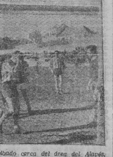
Un jugador ferrolano fue derribado, cerca del área del Alavés. Sus compañeros y los contrarios le atienden y no pasó nada.

UNOS Y OTROS. No jugó bien el Ferrol. Este partido le salió como muchos de esos que perdió o empató en el Estadio, si bien era de esperar otra cosa, después de ese empate logrado en Santander y a raíz de lo que el equipo había mejorado mucho.