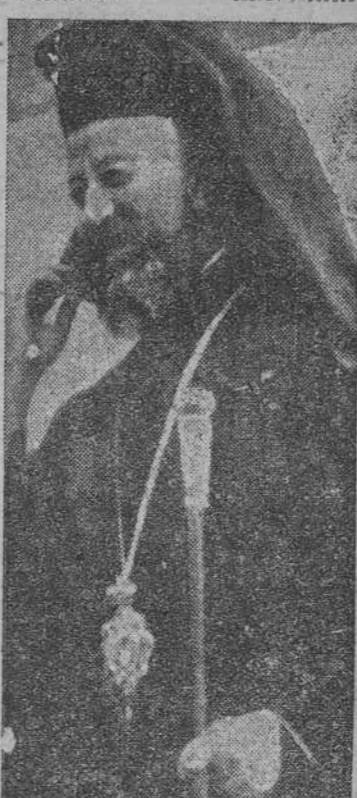
El arzobispo Makarios al bajar del avión en Nairobi, camino de Atenas, de regreso del destierro, condenado por los ingleses en las Islas Seychelles