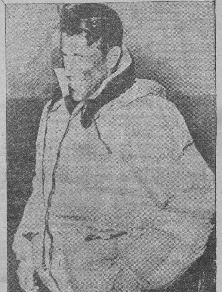
Sir Edmund Hillary, el hombre a quien le queda pequeño el mundo, no descansa. Luego de haber subido a las ocho mil metros de altura del Everest, ha llegado al Polo Sur. Ya estrenando los continentes del mundo, aunque el Polo ya fuera pisado por Scott en 1912