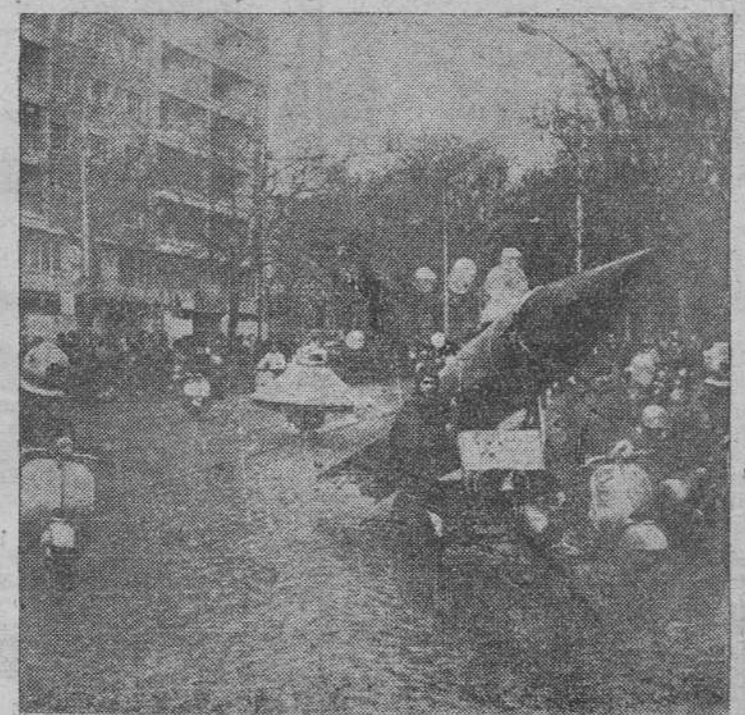
La Cabalgata de Reyes que todos los años organiza La Voz de Madrid, ha estado este año repleta de alusiones a Valencia, el Polo Sur y el Sputnik. Juguetes, alegría y alas para la fantasía de los pequeños de los centros benéficos

La Princesa Josefina Carolina María Albertina de Bélgica había nacido el 18 de octubre de 1872. Su padre fué el Príncipe Felipe, Conde de Flandes y hermanito del Rey Leopoldo II y su madre la Princesa María, de la Casa de Hohenzollern. Contrajo matrimonio la Princesa Josefina, en 1894, con el Príncipe de Hohenzollern. Tuvieron cuatro hijos. El Príncipe Carlos falleció en 1919 y la Princesa Josefina ingresó en el convento de madres benedictinas de Namur en el año 1935, en donde ha vivido desde entonces. —Efe.