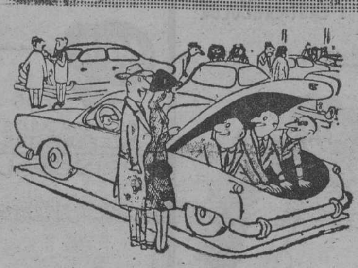
—Este coche me gusta. Ah, podemos llevar a tu madre.

ESAS, A CIEGAS En una agencia matrimonial un aspirante a casado examina la lista de candidatas. Le van mostrando fotografías de ellas; pero echando de menos alguna pregunta: —Esta que tiene cinco millones de dote, ¿cómo es? ¿Qué le está mostrando la foto gratis? —Imposible, señor. En cuanto la dote pasa de un millón, son innecesarias las fotografías. ERROR, ERA INVITACION Un vaquero va por el desierto de Arizona y se encuentra con otro. Este último inicia el ademán de llevarse la mano al bolsillo de atrás del pantalón y el primero entonces, le pega dos tiros y lo mata. Examina el cadáver y al mirarle el bolsillo de atrás del pantalón encuentra en él tan sólo un frasco plano de whisky. —¡Caramba!, dice—. Lo que quería era invitarme a un trago de whisky, pero me quedé delante, junto a papá