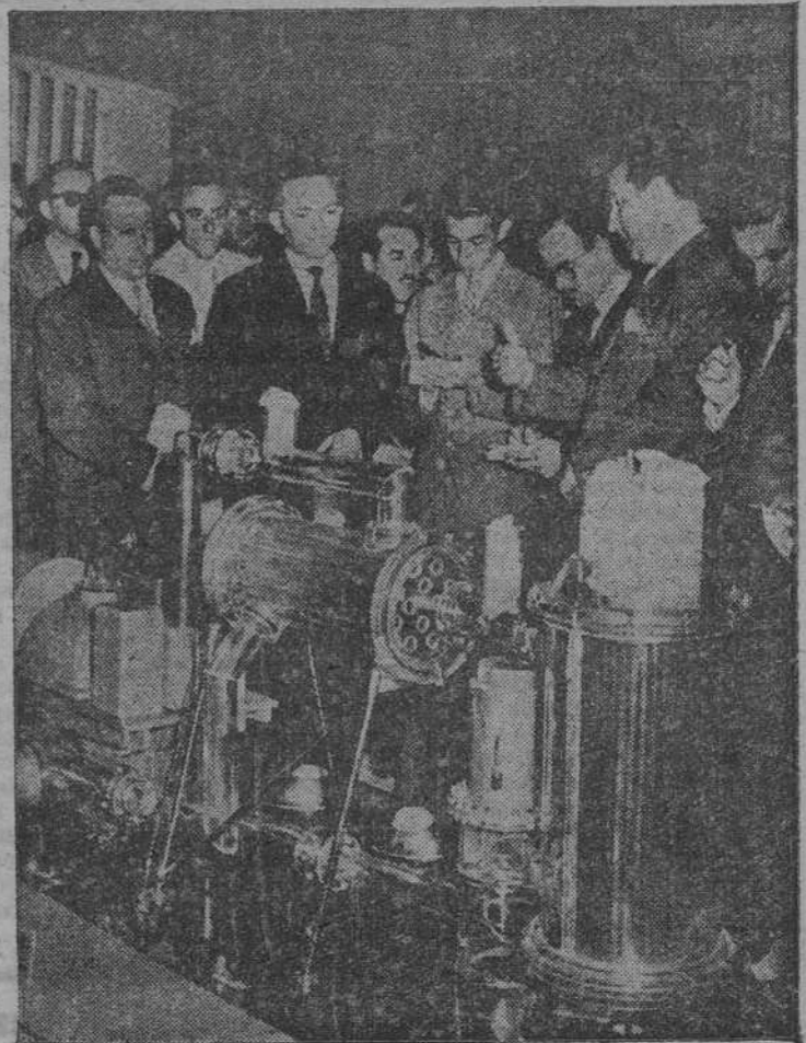
...del átomo y sus usos pacíficos, en su visita a la Exposición "El átomo y sus usos pacíficos", que será inaugurada a primeros de mayo en el recinto de la Feria del Campo