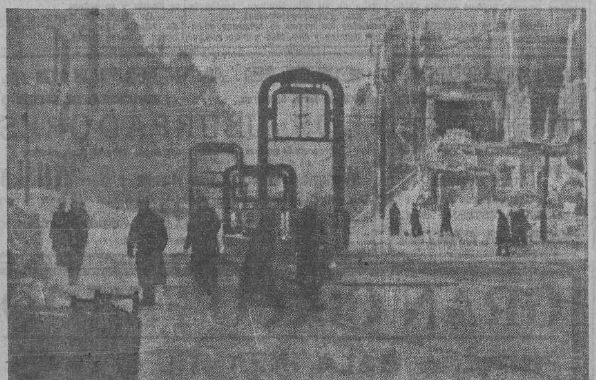
Una de las capitales más hermosas del mundo, ha quedado convertida en ruinas. Berlín ofrece el aspecto desolador y terrible de los grandes cataclismos. Después de haber sufrido continuos e intensísimos bombardeos aéreos, se halla ahora sometido a un furioso fuego artillero. Cañones de todos los calibres disparan sin cesar contra la devastada ciudad. Lugares y edificios no son más que montañas de escombros. Puede juzgar el lector de la magnitud de la catástrofe por la fotografía, en la que aparece la entrada del "Metro" en el cruce de las calles Kurfürsten y Potsdam, X, a pesar de todo, se mantiene tenazmente la heroica resistencia.