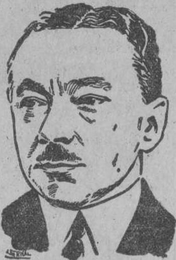
Paul Reynaud, ex-presidente del Consejo francés, ocupó la jefatura del Gobierno cuando ya era inevitable e incontestable el aluvión germano. Sus memorias, junto con una exposición de los hechos vistos en primer plano, son un alegato contra la falta de preparación que condujo a Francia a ser "venida, invadida, ocupada, 'razziada', pisoteada y humillada"

Las memorias de Paul Reynaud, ex-presidente del Consejo de Ministros de Francia, cuya publicación iniciamos hoy, precedidas de una extensa introducción en la que su autor expone las razones que le han aconsejado dar a conocer a su país cuanto ocurrió en los años anteriores a la gran catástrofe.