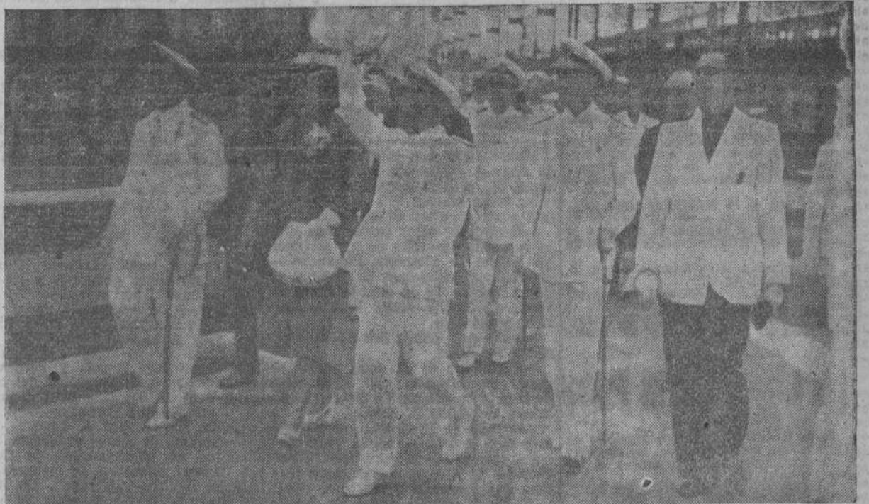
El Caudillo hace su entrada en el Astillero donde fué recibido por delirantes aclamaciones y vítores de la multitud