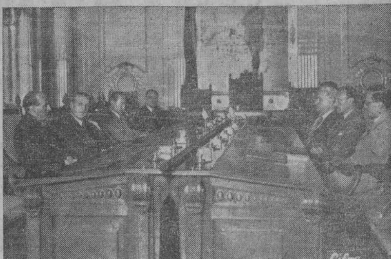
SAN SEBASTIAN.—Los delegados franco-españoles que estudian el acuerdo comercial entre España y Francia, reunidos en el Palacio de la Diputación