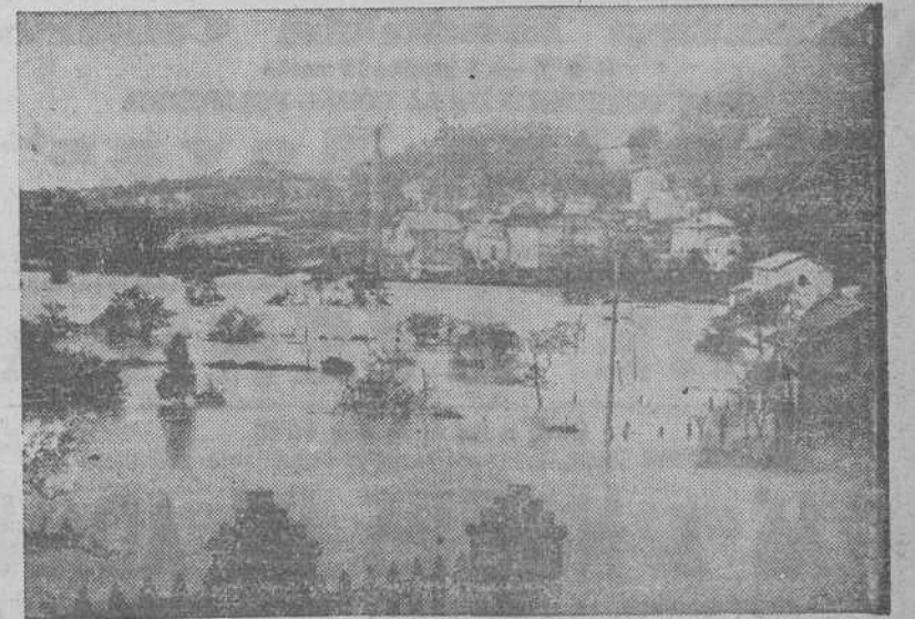
Estado en que quedó el pueblecito de Veriña, próximo a Gijón, con motivo de las lluvias caídas recientemente. Al fondo, la "Azucarera Asturiana", que sufrió importantes pérdidas por inundación total de sus departamentos.