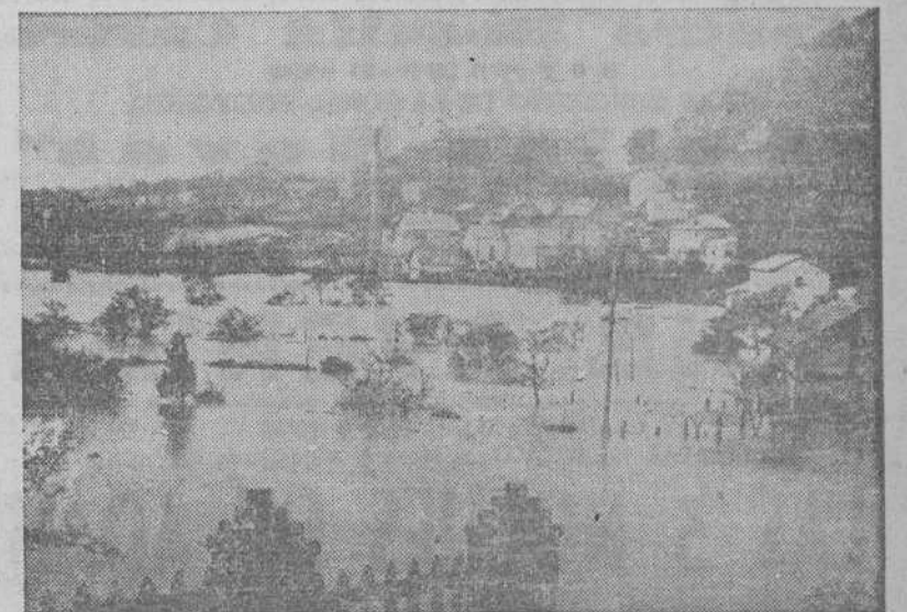
Estado en que quedó el pueblecito de Veriña, próximo a Gijón, con motivo de las lluvias caídas recientemente. Al fondo, la "Azucarera Asturiana", que sufrió importantes pérdidas por inundación total de sus departamentos.