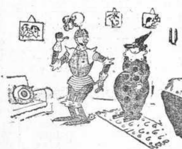
—¿Me hace usted el favor de rascarme la espalda? (De "London Opinion", Londres).