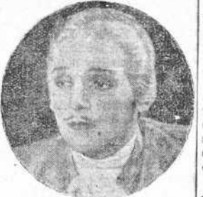
DOUGLAS FAIRBANKS JR. ELIZABETH BERGNER Una maravilla de arte

SAVOY-VIERNES El nombre que evoca la historia de un Imperio en pleno apogeo y las aventuras de una mujer inteligente y apasionada CATALINA DE RUSIA EN ESPAÑOL