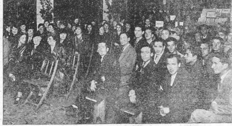
1. El general señor Martínez Monge que pronunció el lunes su conferencia en el Casino de Clases. 2. Acto de repartición de premios a los alumnos de la Escuela Nocturna Obrera.