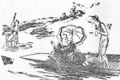
La madre: —¿Qué es ese ruido que se oye por detrás? (De "The Humorist", Londres).

EL IDEA LGALLEGO ruega a sus lectores que compren con preferencia en los establecimientos que se anuncian en estas columnas. E- la propaganda más eficaz para nosotros. Pero es indispensable advertir en este establecimiento correspondiente que se compra por haber visto el anuncio en EL IDEAL GALLEGO.