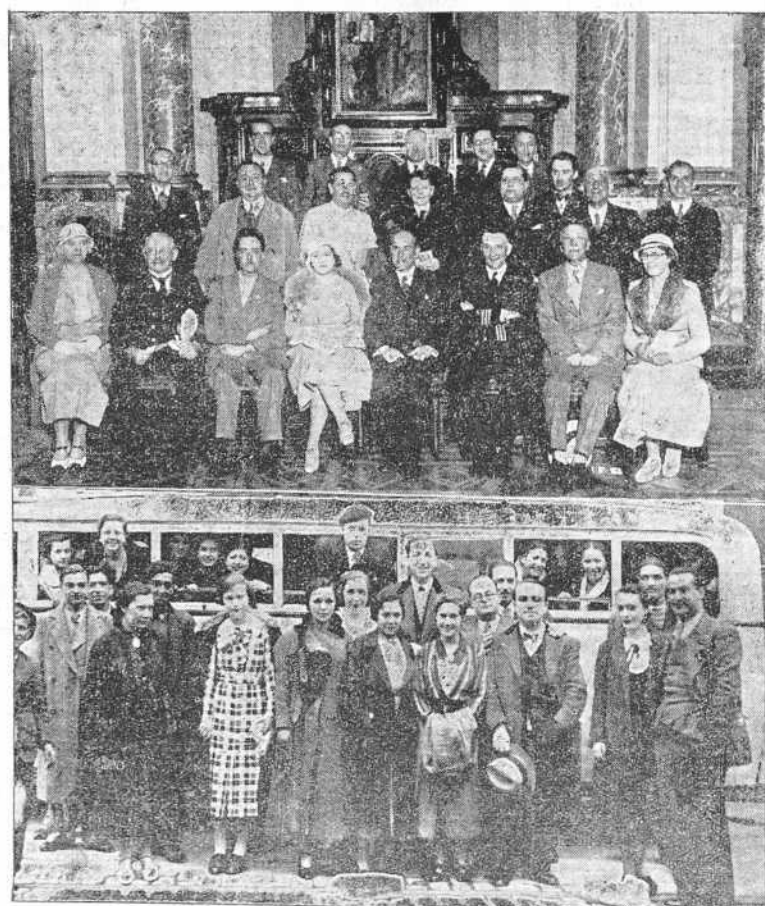
1. Oficiales y viajeros del barco de turismo "Arandera Star", que ayer tocó en nuestro puerto, en su visita oficial al Ayuntamiento.--2 Un grupo de socios de la "Reunión de Artesanos", que ayer salieron de excursión por la provincia.