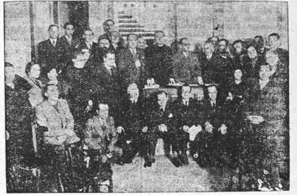
Uno de los grupos de los delegados provinciales en la Asamblea de maestros católicos de Madrid

EL IDEAL GALLEGO Se vende en Villagarzosa: En el kiosco de Feyan o Cafe Universal. En el kiosco de Ramón. Y en la estación del ferrocarril.