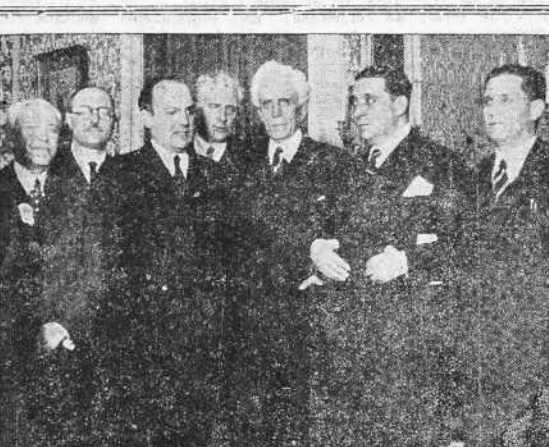
Comisión de representantes de la ciudad de Vigo, presididos por el alcalde señor Hidalgo, en su visita oficial al presidente del Consejo, señor Portela Valladares, para solicitar del mismo diversas mejoras para aquella importante ciudad gallega (Fot. Vidal).