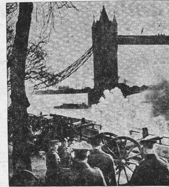
Ciento un cañonazos disparados desde la torre de Londres anunciaron la muerte del Rey Jorge