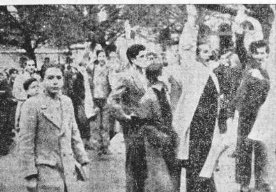
LA CORUSA.—Los estudiantes del Instituto despejando la plaza de Pontevedra al ser sorprendidos por la fuerza pública

Es inútil decir a los ciudadanos que quieren aplastar la revolución que si, obedeciendo a sugerencias o temores, dan sus votos al "portelismo" habrán hecho estas dos cosas: favorecer indirectamente el triunfo revolucionario y sentar el precedente de que cualquier político ambicioso no tenga el menor escrúpulo en lo sucesivo en seguir, para su particular conveniencia política, el camino trazado.