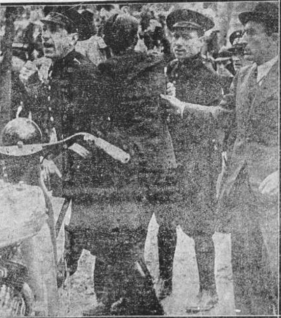
MADRID.—Durante el desfile militar del martes y en las proximidades de la tribuna presidencial un individuo, embriagado, hizo estallar una traca que causó el consiguiente revuelo. En las fotografías se recogen dos momentos de dicho incidente. Las fuerzas del Ejército disponiéndose a adoptar medidas de previsión y los guardias de Asalto en el momento de detener al autor de dicho disturbio. (Fotos Vidal).