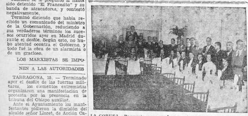
LA CORUÑA.—Banquete con que fueron obsequiados los jugadores del "Artabro" con motivo de los recientes éxitos logrados por este equipo..