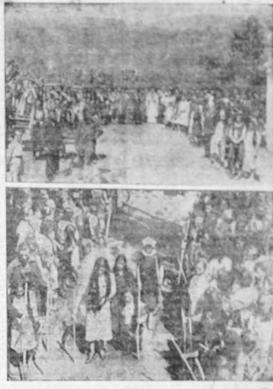
Un aspecto de la procesión de San Justo, en San Jorre de Sacos (Pontevedra), donde se inspiró la famosa canción "Carballiña de San Xusto". Fieles cumpliendo promesas en la procesión de San Roque, en Sárdoma (Vigo).