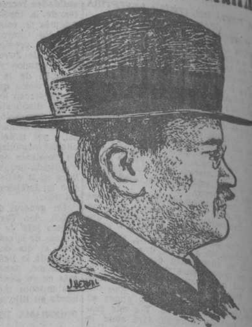
Por RAFAEL SALAZAR

Las seguridades de lealtad y adhesión dadas por el jovenzuelo le franquizaron la entrada en el partido. En la redacción del periódico "Izvestia" conoció, poco después, a Lenin y al propio Stalin, que muy pronto había de alcanzar fama entre sus compañeros merced al asalto a un banco de Tiflis. Molotov cambió de nombre en aquella época, adoptando el seudónimo con que hoy es universalmente conocido, para mejor burlas a la justicia. Sus precauciones no impidieron que fuese varias veces detenido y una de ellas deportado a Siberia. Unió sus destinos a los de Stalin y acertó al elegir entre los diversos bandos que años después habían de hacerse la guerra, porque Stalin, que en su triunfo fué implacable con sus rivales, no olvidó a Molotov a la hora de repartir prebendas. Juntos fueron, en 1922, a secretaría del partido comunista; uni-