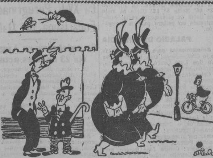
LA VISTA ENGAÑA, por MIRANDA.

—¿Cualquiera diría que son dos hermanas! —Pero... ¿No son dos hermanas? —Son tres! ¡Es que la otra no va con ellas!