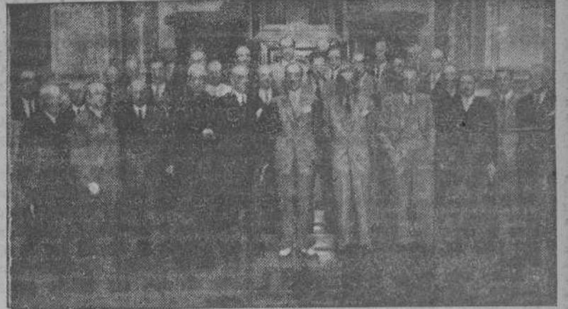
El señor Gobernador Civil y el señor Alcalde con las personalidades que concurrieron a la reunión del Patronato del Plan Agrícola de Galicia, celebrada ayer en el Palacio Municipal (INFORMACION EN LA PLANA TERCERA).