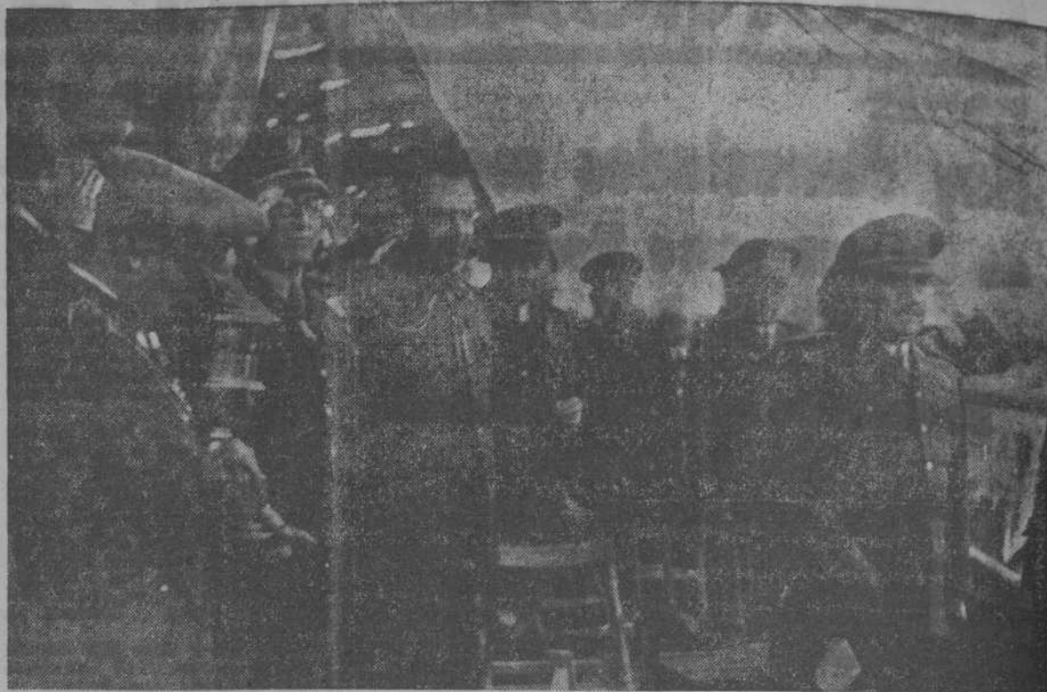
S. E. el Jefe del Estado se dispone a abandonar la tribuna después de entregar la Copa al Comandante Mufiz, ganador del premio del Generalísimo en el Concurso Hípico Internacional, disputado en la Casa de Campo.