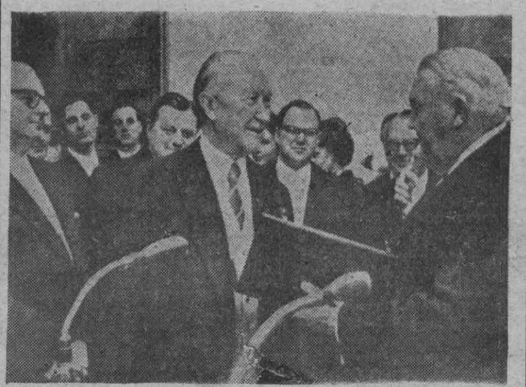
El canciller de la República Federal Alemana ha celebrado su ochenta y cuatro cumpleaños. El ministro de Economía le felicita y le ofrece un regalo en nombre del Gobierno.