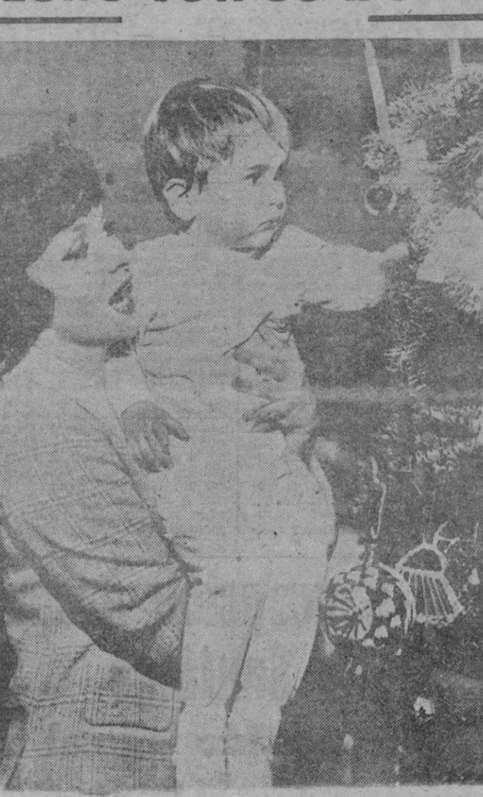
Con su hijo Mikko en los brazos, ante el árbol de Navidad. Gina Lollobrigida protagoniza esta tierna y humana escena en la villa donde vive en Roma y donde ha pasado las fiestas navideñas.