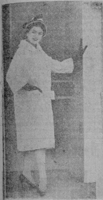
P. Liétart, de Bélgica, creó este abrigo de piqué blanco para Miss Algodón.

Bajo el título de "Madrid, capital de la Moda", el día 23 de mayo celebró en los jardines del Retiro el I Gran Festival de la Moda, presidido por las excelentísimas Duquesa de Alba, de Pastana, esposa del embajador de los Estados Unidos, Marquesa de Susca, Casa Pizarro y señora de Fierro. En él se presentaron los modelos de las 27 firmas más prestigiosas que integran el Grupo Nacional de Alta Costura Española y de cuya creación, pusimos en conocimiento de nuestras lectoras en crónicas anteriores.