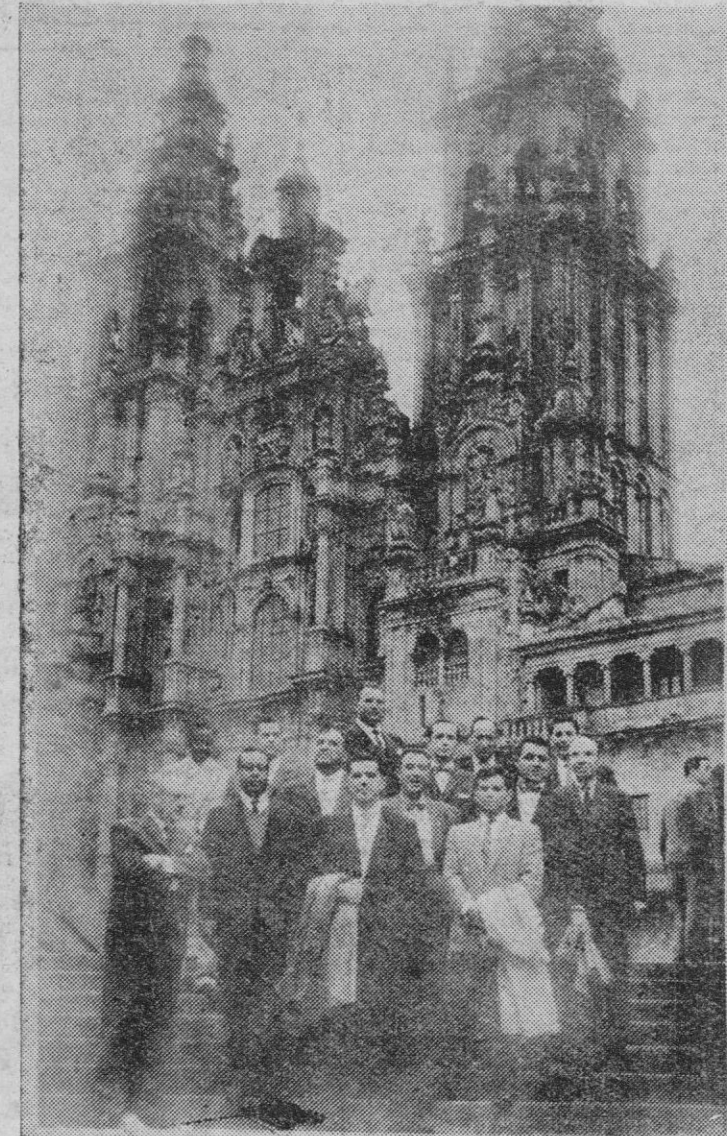
Grupo de delegados culturales de la Unesco, que después de asistir a una reunión en Madrid llegaron a Santiago. En su mayoría arquitectos, estos delegados visitaron con detenimiento la zona monumental de la Ciudad del Apóstol siguiendo viaje a Lugo.