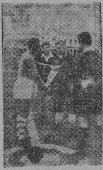
Entrega de banderines