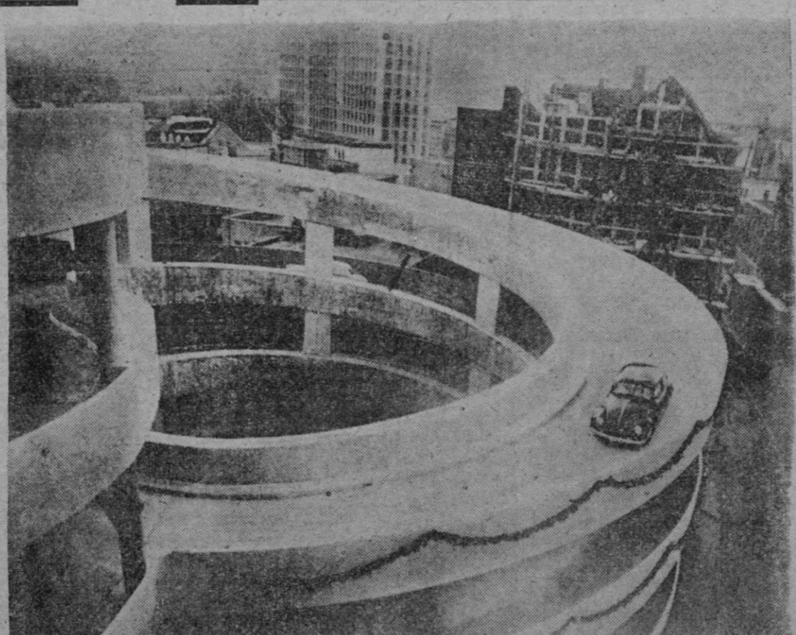
Esta edificación de apariencia extraña no es sino la “espiral de Wuppertal”, la más novísima concepción urbanística para la solución del problema de aparcamiento de automóviles. La ciudad alemana lo ha resuelto así, y para completar la curiosa historia, al final de ella se han establecido unos almacenes: los derechos de aparcamiento se cancelan contra los desembolsos hechos por compras.

PARA ZAPATOS ELEGANTES REFRACCIONES Prince REAL RA-FERRI