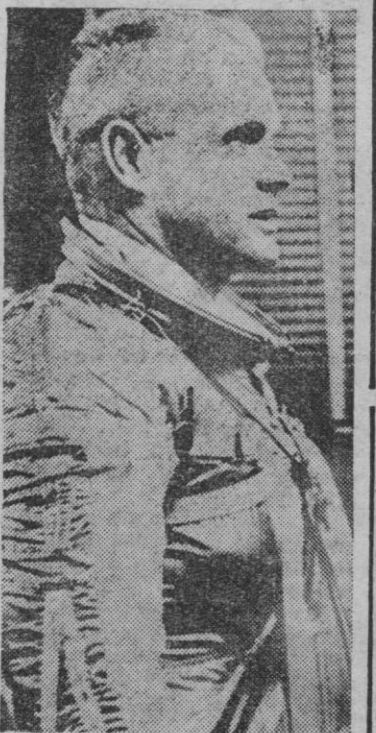
JOHN H. GLENN

Los que aguardamos en compacto grupo el lanzamiento de Glenn hemos tenido una satisfacción, porque un "Titán" partió en nuestra presencia hacia su cincuenta prueba con notable éxito. Este cohete de combustible sólido supone una mejora notable (PASA A SEPTIMA PAGINA)