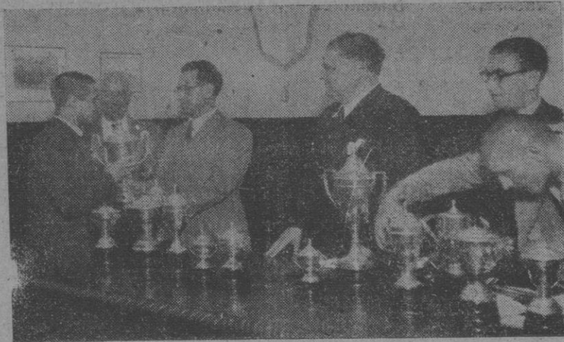
Entrega de trofeos y numerario a los representantes de los clubs modestos, acto celebrado en la Federación Gallega de Fútbol

Ayer, a las siete de la tarde, tuvo lugar en el local social de la Federación Gallega, la entrega de trofeos y reparto de los ingresos obtenidos durante la temporada 1946-47, a los clubs modestos coruñeses de la capital y marifas.