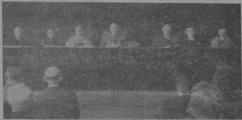
Presidencia del acto académico celebrado con motivo de la inauguración del curso escolar en los Centros docentes coruñeses

Presidió el acto, el Capitán General de la Región